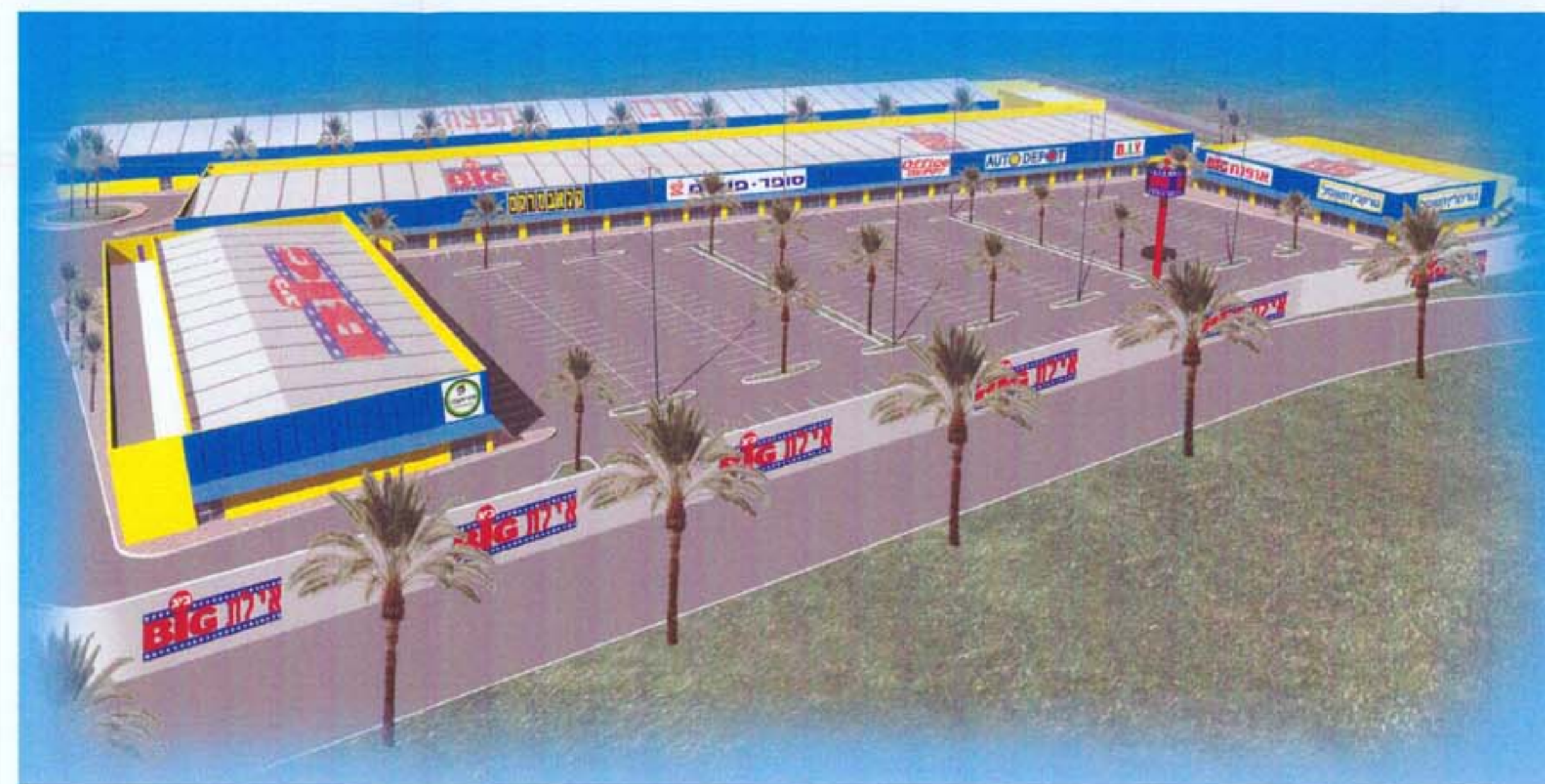
מבט מכוון כביש הערבה