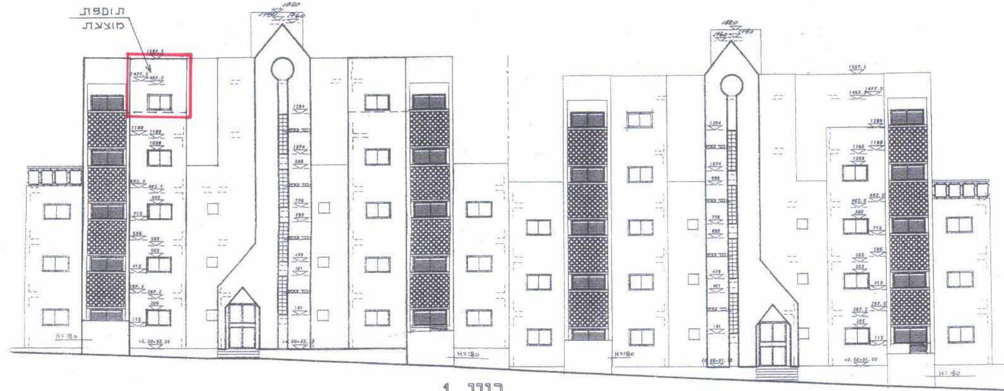
בנין 1 חזית צפונית - קני"מ 1:200