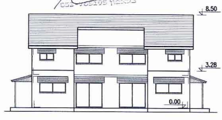
חזית קדמית קנ"מ 1:200