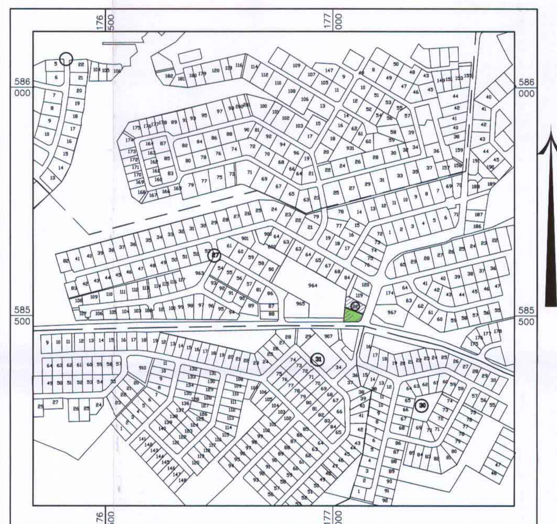
תרשים סביבה קרובה 1:5000