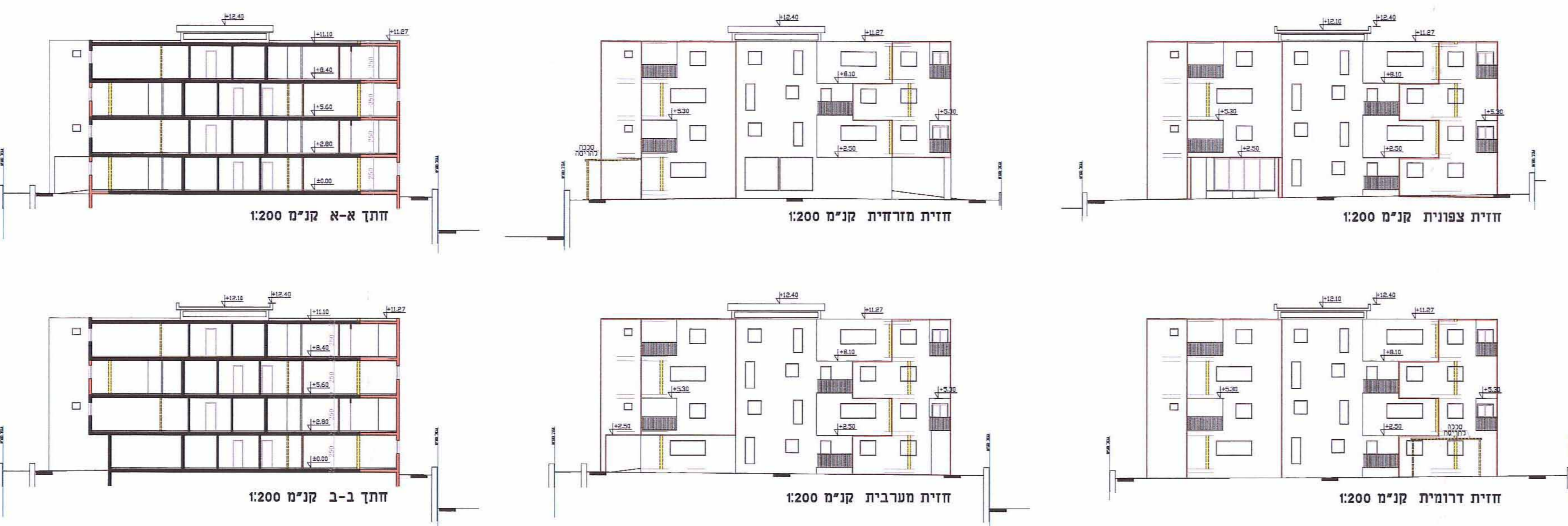
חיתוך א-א קני"מ 1:200, חיתוך ב-ב קני"מ 1:200, חיתוך מרחבית קני"מ 1:200, חיתוך צפונית קני"מ 1:200, חיתוך דרומית קני"מ 1:200, חיתוך מזרחית קני"מ 1:200