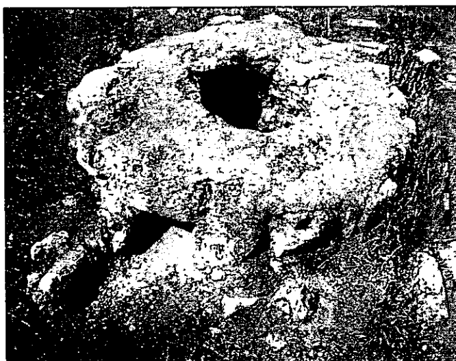
איור 5. בור המים (אתר 7).

7. (נ.צ. 179003 584946) בור מים בעל פתח מרובע בנוי (0.6X0.6 מ', גובה: 0.4 מ'). הפתח בנוי מאבני גוויל מלוכדות בבטון (איור 5).