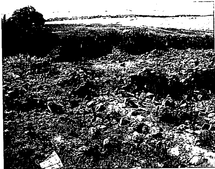
איור 1. החווה (אתר 1).