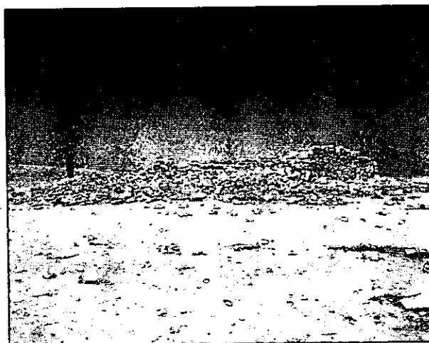
איור 7. השומרה (אתר 12).

12. (נ.צ. 179777 584609) שומרה (6X10 מ') שקירותיה, הבנויים מאבני קרטון ללא חומר מליטה, השתמרו לגובה 1.6 מ'. צמוד לצד הדרומי של המבנה נמצאת חצר פתוחה (10X3 מ'). שומרה זו אופיינית לבניה באזורי הספר בזמן תקופת המנדט (איור 7).