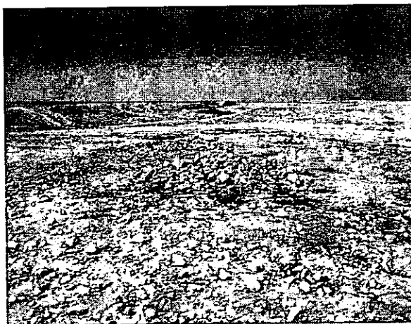
איור 6. חווה ושתי קברים (אתר 9).

9. (נ.צ. 179294 584816) חווה (15X20 מ') מכוסה באדמת סחף. ניתן להבחין במבנה מרכזי (10X10 מ') וממערב לו חצר (15X10 מ'). החווה בנויה מהאבני קרטון לא מסותתות. שני קברים בדויים נמצאו בתוך שטח המבנה. סביב החווה נמצאו חרסים מתוארכים לתקופה הביזנטית ותקופה האיסלמית הקדומה (איור 6).