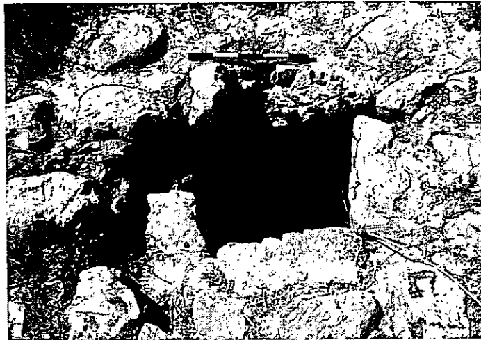
איור 3. בור המים (אתר 5).

5. (נ.צ. 179199 586065) בור מים בעל פתח מרובע ( 0.5X0.5 מ') חצוב על מדרגת סלע. נמצא על גדה הצפונית של הנחל (איור 3).