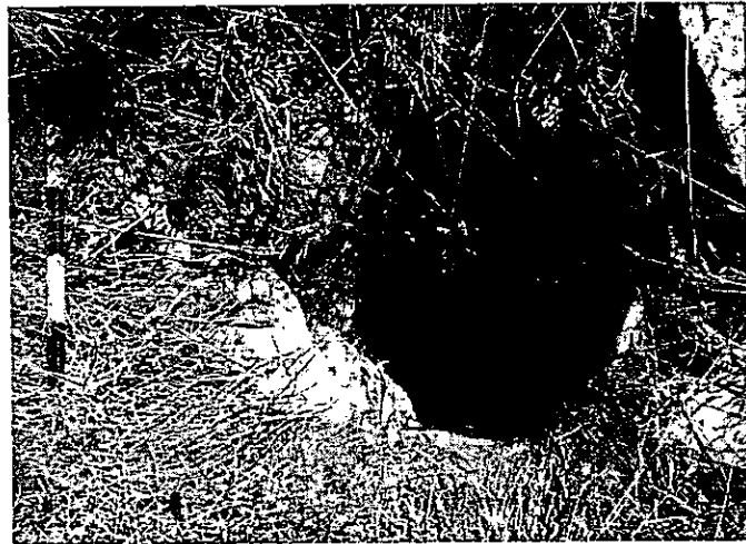
איור 2. בור המים (אתר 4).

4. (נ.צ. 179646 586065) בור מים בעל פתח משושה (0.40X0.40 מ') חצוב במדרגת סלע מכוסה באדמת סחף (איור 2).