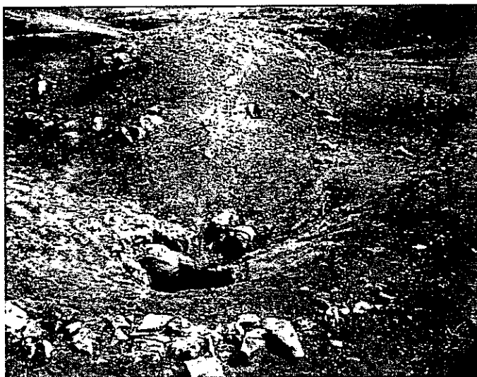
איור 4. בור המים (אתר 6).

6. (נ.צ. 178677 585185) בור מים בעל פתח אי-רגולרי (קוטר 0.8 מ') חצוב ישירות במדרגת סלע הנמצאת על גדה הדרומית של הנחל (איור 4).