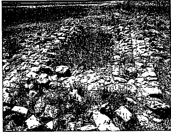
איור 8. השומרה (אתר 14).

14. (נ.צ. 179840 584909) שומרה מלבנית (4X10 מ') בעלת שלושה חדרים. קירותיה בנויים מאבני קרטון לא מסותתות והם השתמרו לגובה 0.5 מ'. בסביבתה נמצאו חרסים המתוארכים לתקופה הביזנטית והתקופה האיסלמית הקדומה (איור 8).