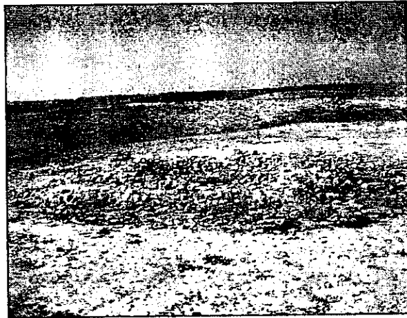
אור 9. החווה (אתר 24).

24. (נ.צ. 179685 583511) חווה המורכבת ממבנה בעל שני חדרים (5X7 מ') הנמצא במרכז של חצר (15X15 מ'). קירות המבנה והחצר בנויים מאבני קרטון לא מסותתות והשתמרו לגובה 0.6 מ' (איור 9).