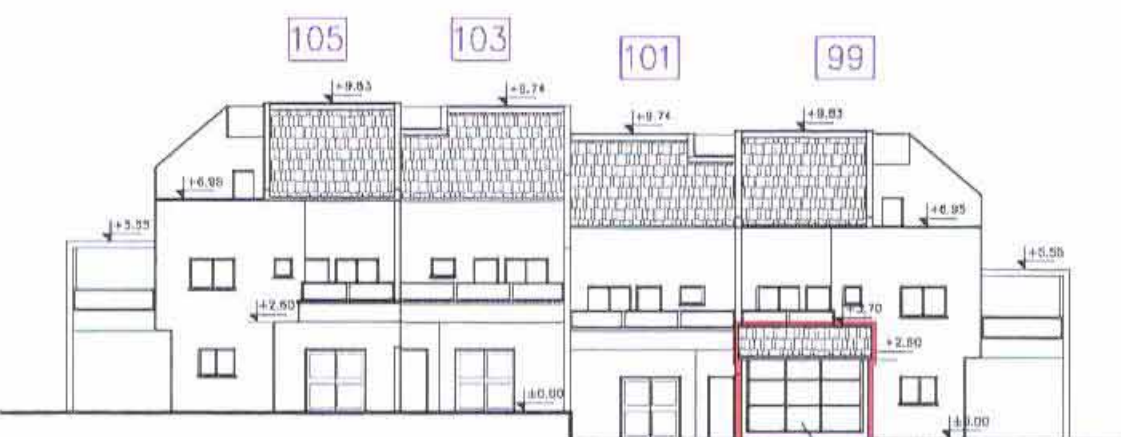
חזית צפון מערבית 1:250