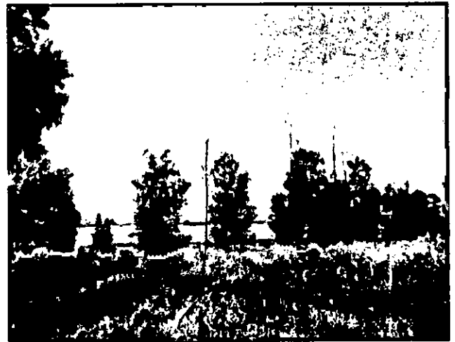
שורת עצים המחברת בין שני גושי עצים