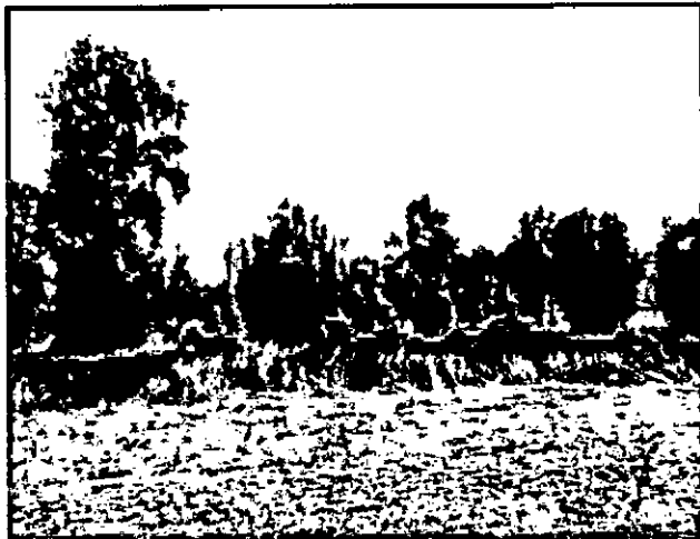
מצב העצים באופן כללי

לדוגמה - עץ מס' 50 - עץ יפה הנמצא בין מגרש 131 לדרך 611