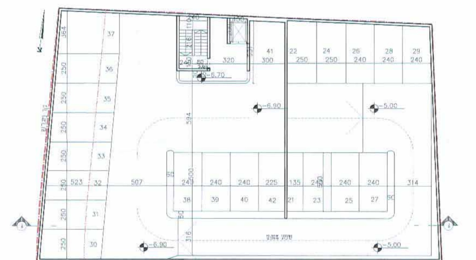
תכנית קומת חניות במפלס -6.90 קנ"מ 1:200