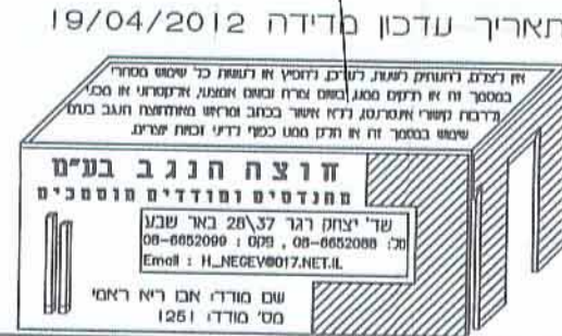
תאריך עדכון סידרה 19/04/2012

חוק המבנים והתשתיות חוק התכנון והמבנים חוק הגנת השכונות חוק הגנת הנוף חוק הגנת המרחב חוק הגנת המים חוק הגנת האוויר חוק הגנת הקרקע חוק הגנת הנוף חוק הגנת המרחב חוק הגנת המים חוק הגנת האוויר חוק הגנת הקרקע