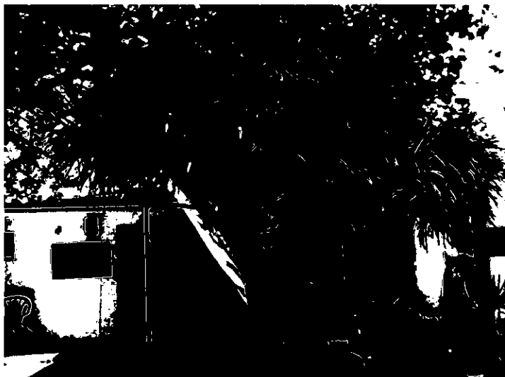
עץ מסי 870 – דרקונית קנרית