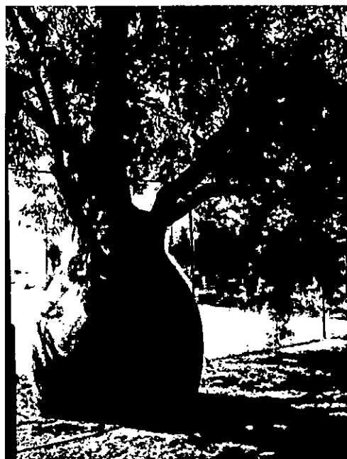
עץ מסי 933 – ברכיטון הסלעים