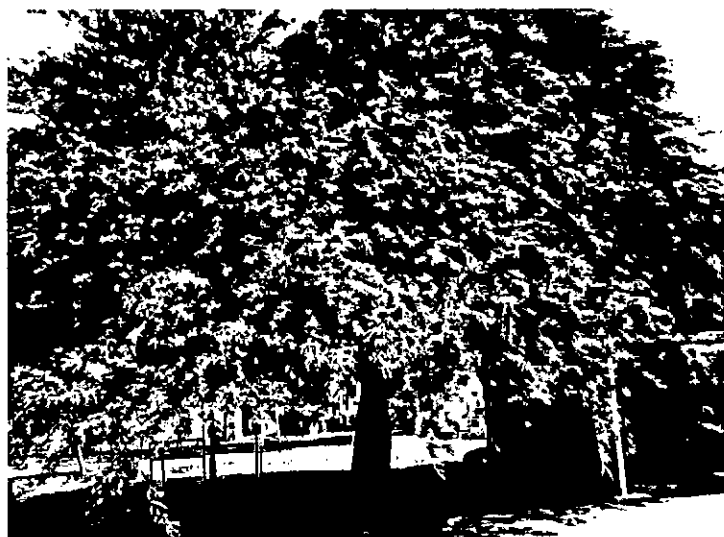
עץ מסי' 723 – ינבוט לבן