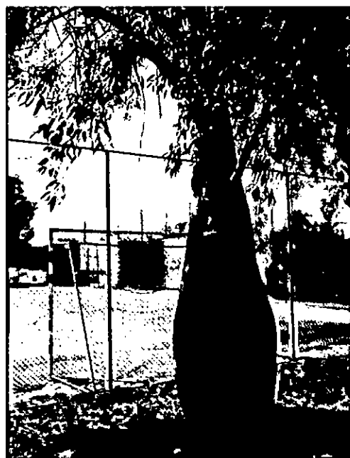
עץ מסי 934 – ברכיטון הסלעים