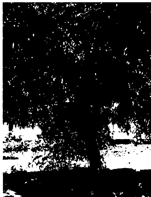
עץ מסי 512 – אגוז החמאה