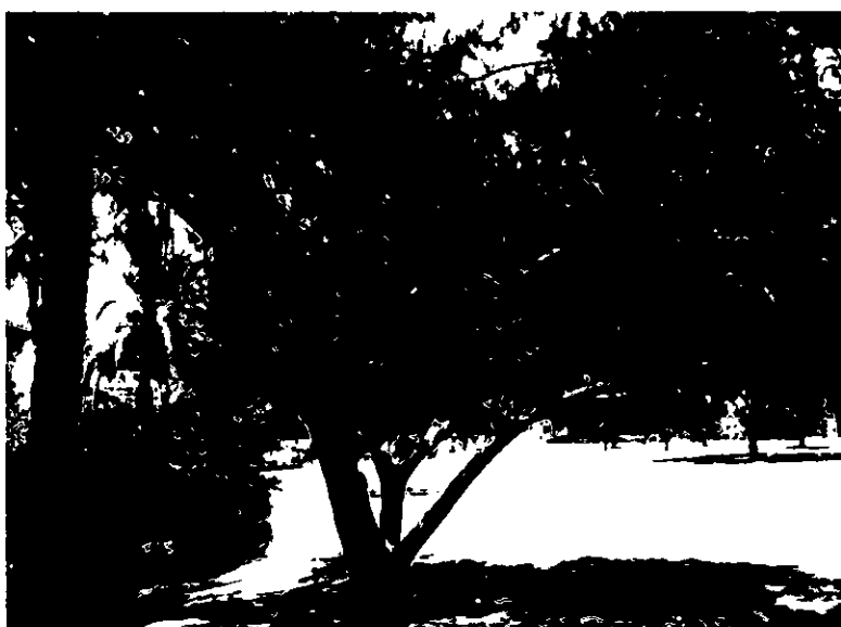
עץ מסי 1060 – ערער פיצריאנה גרין