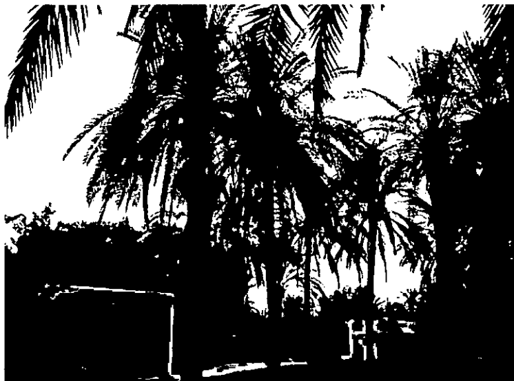
עצים מסי' 1032-1035, 1037-1042, 1044, 1045, 1048, 1049 ו- 1051 – דקל תמר