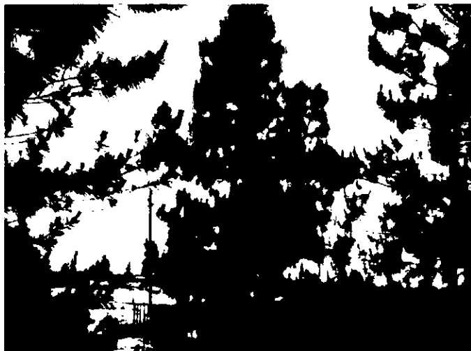
עץ מסי 1441 - אורן קנרי