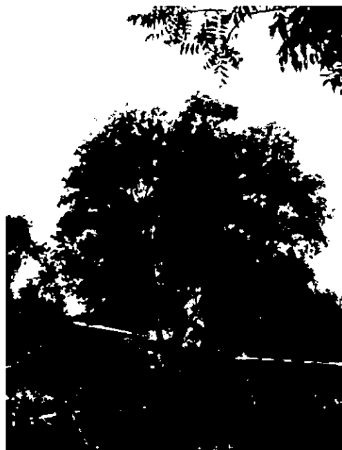
עץ מסי 1055 - טבוביה איפה