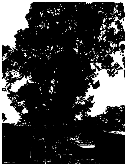
עץ מסי 120 – אקליפטוס המקור