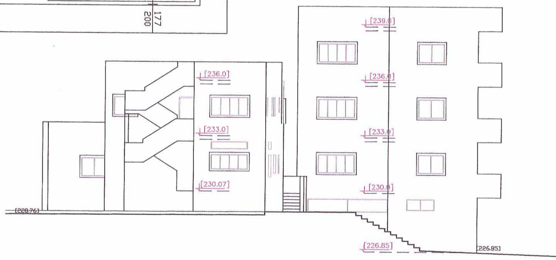
חזית מערבית סכימטי - קנ"מ 1:125