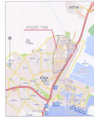
מפת התמצאות קנ"מ 1:25000