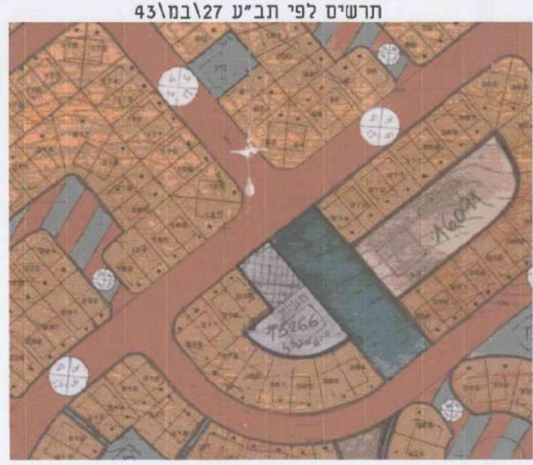
חריטת לופי חביע 27 בנובמבר 2016

מספר תוכנית חירום מספר תוכנית חירום מספר תוכנית חירום מספר תוכנית חירום מספר תוכנית חירום