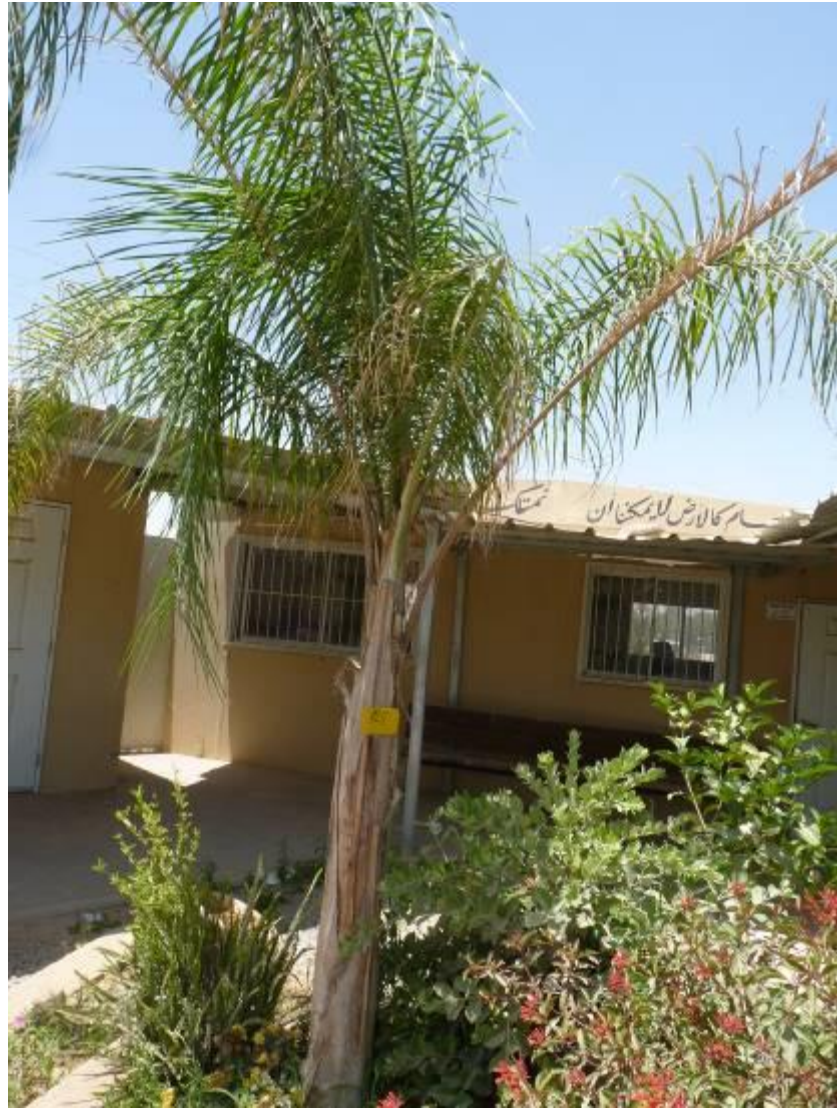
עץ מסי 125