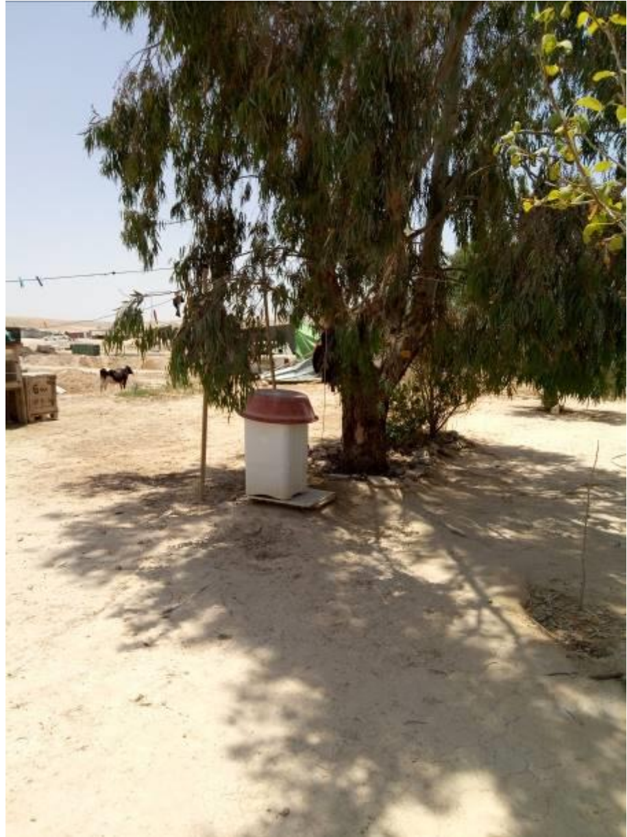
עץ מסי 12