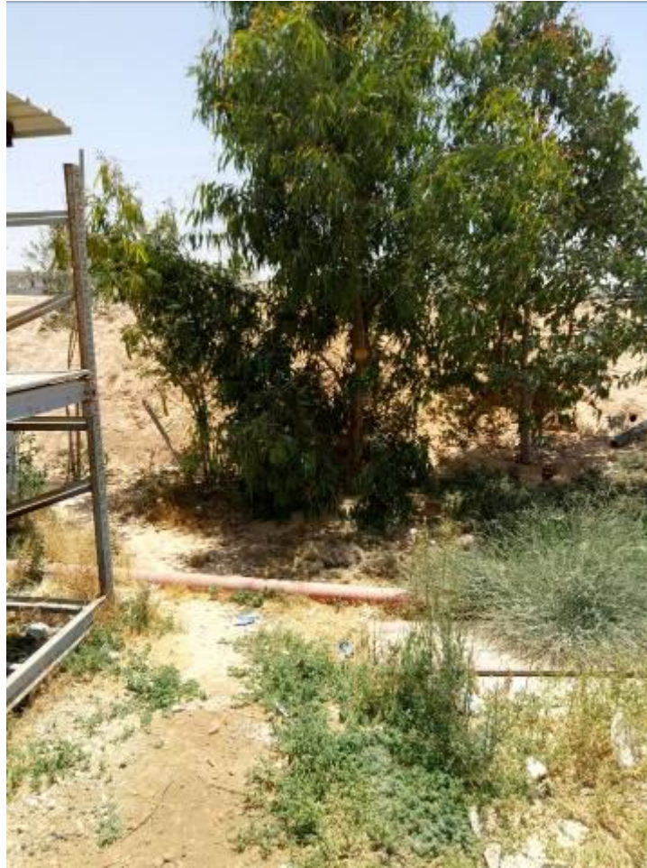
עץ מסי 8