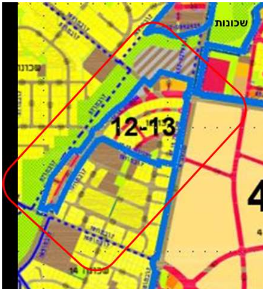
איור 1: אזור תוכנית שכונות המגורים 12-13 מסומן על גבי מפה הישוב.