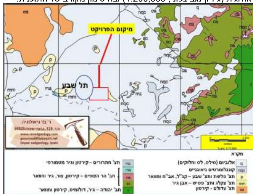
איור 3: מפה גיאולוגית (גיליון נגב צפוני, 1:200,000) ובה סימון מקורב של התוכנית.

ה. אלוביום (q) – מילוי הנחלים והערוצים מורכב ממשקעים איאוליים (משקעי אבק – לס) ומשקעים נחליים מגיל רביעון (מלפני 2.6 מ"ש ועד ההווה), המופיעים לרוב באזורים הנמוכים של השטח, בבסיס הגבעות ובערוצי נחלים. הלס מורכב מטין שהרכבו משתנה בין חולי וחרסיתי. גשמים הביאו לשטיפתו של האבק והצטברותו במקומות הנמוכים בטופוגרפיה. שכבות חלוקים , ברובן כוללות ריכוז דקים ניכר, מציינות אפיזודות של שטפונות בעוצמה גבוהה אשר הובילו גושי סלע ממחשופים בתחום אגן הניקוז של נחל גז.