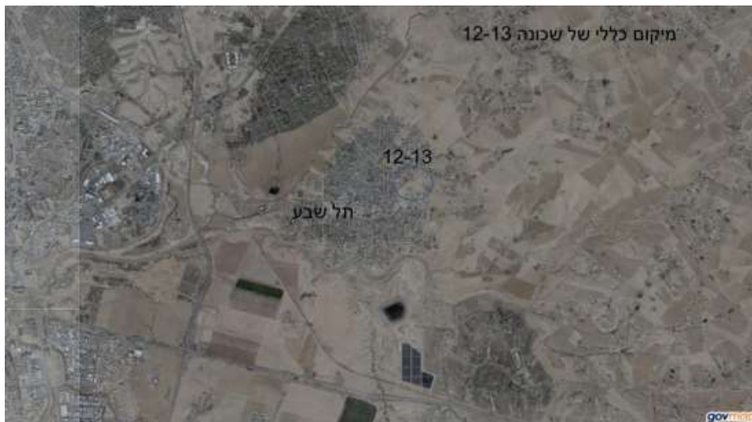
איור 2: אזור תוכנית שכונת 12-13 על רקע אורתופוטו.