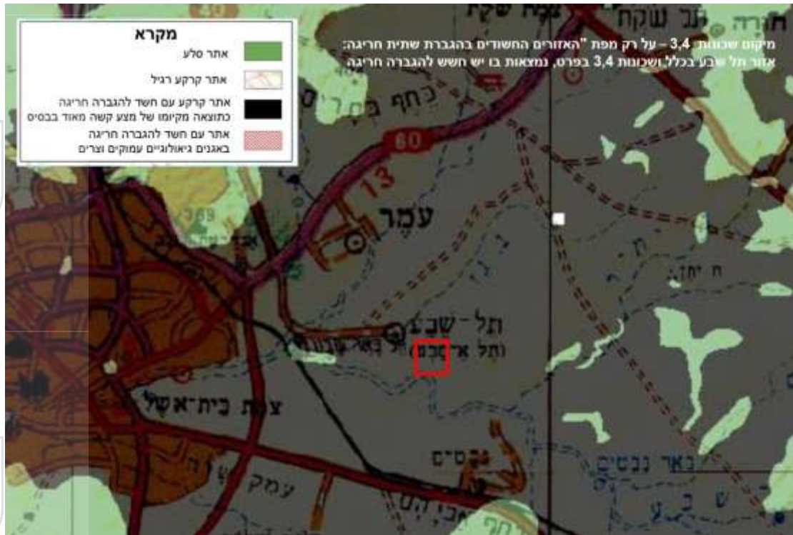
איור 6: מפת האזורים החשודים בהגברת תשתית. שטח התוכנית מסומן בריבוע אדום. תחום האתר מוגדר כ"אתר קרקע עם חשד להגברה חריגה כתוצאה מקימו של מצע קשה בבסיס".