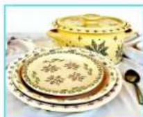
כלי אירוח והגשה