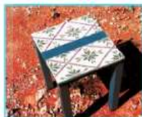
רהיטים ומוצרי גן