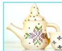
תה וביקור בגלריה