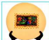
מתנות וצלחות רקומות