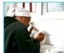
אני אישה בדואית עצמאית