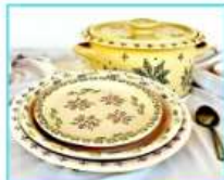
כלי אירוח והגשה