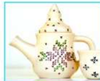
תה וביקור בגלריה