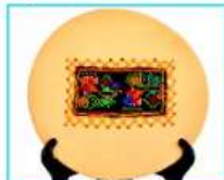
מתנות וצלחות רקומות