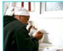
אני אישה בדואית עצמאית