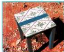
רהיטים ומוצרי גן