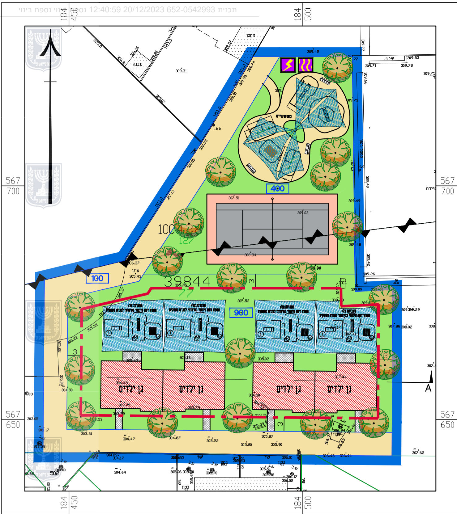
תכנית בנין 1:500

חוק התכנון והבנייה, התשכ"ה - 1965 תכנית מפורטת