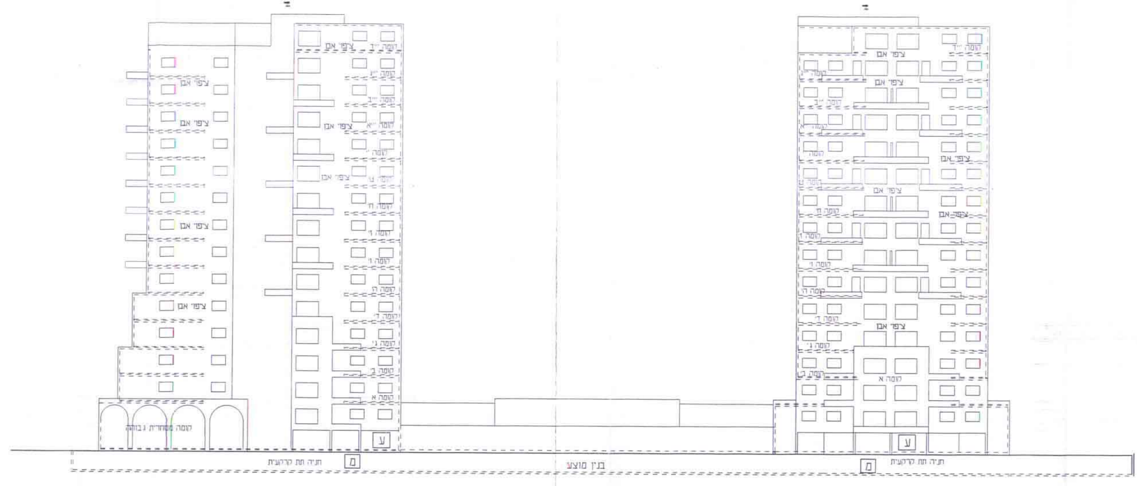
חזית דרומית קנ"מ 1:250

מקרא באור סימני נשפח הבינוי: (1) מס' קומה ע קומת עמודים מ חזית