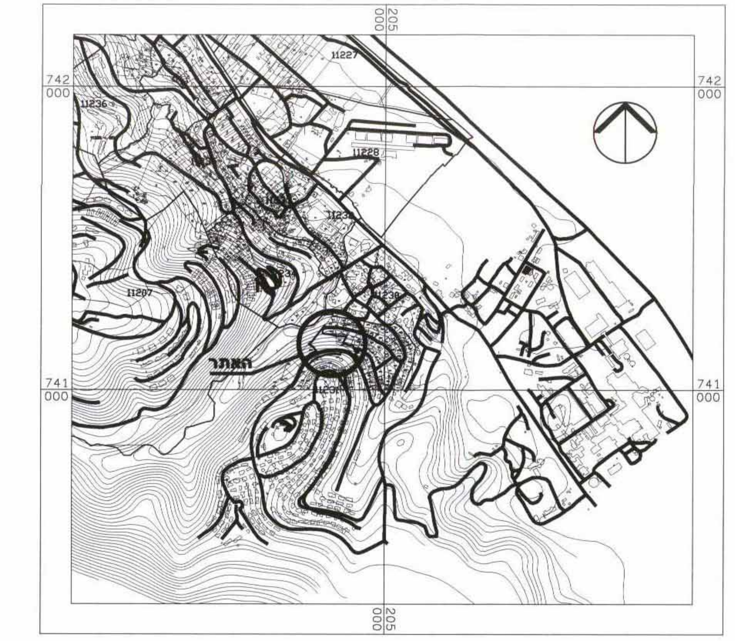
תרשים סביבה קני"מ : 1:10000