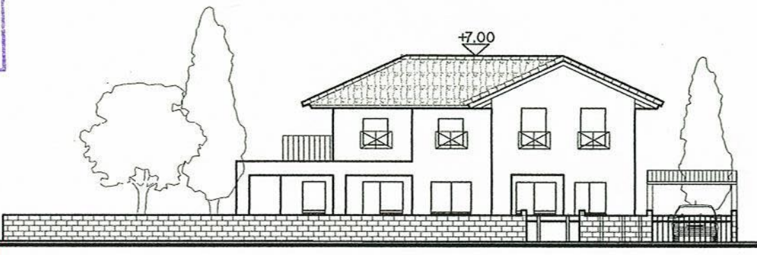
חזית קני"מ 1:200

הודעה על הפקדת תוכנית מס' מב/679 פורסמה בילקוט הפרסומים מס. 5372 מיום 9.11.04