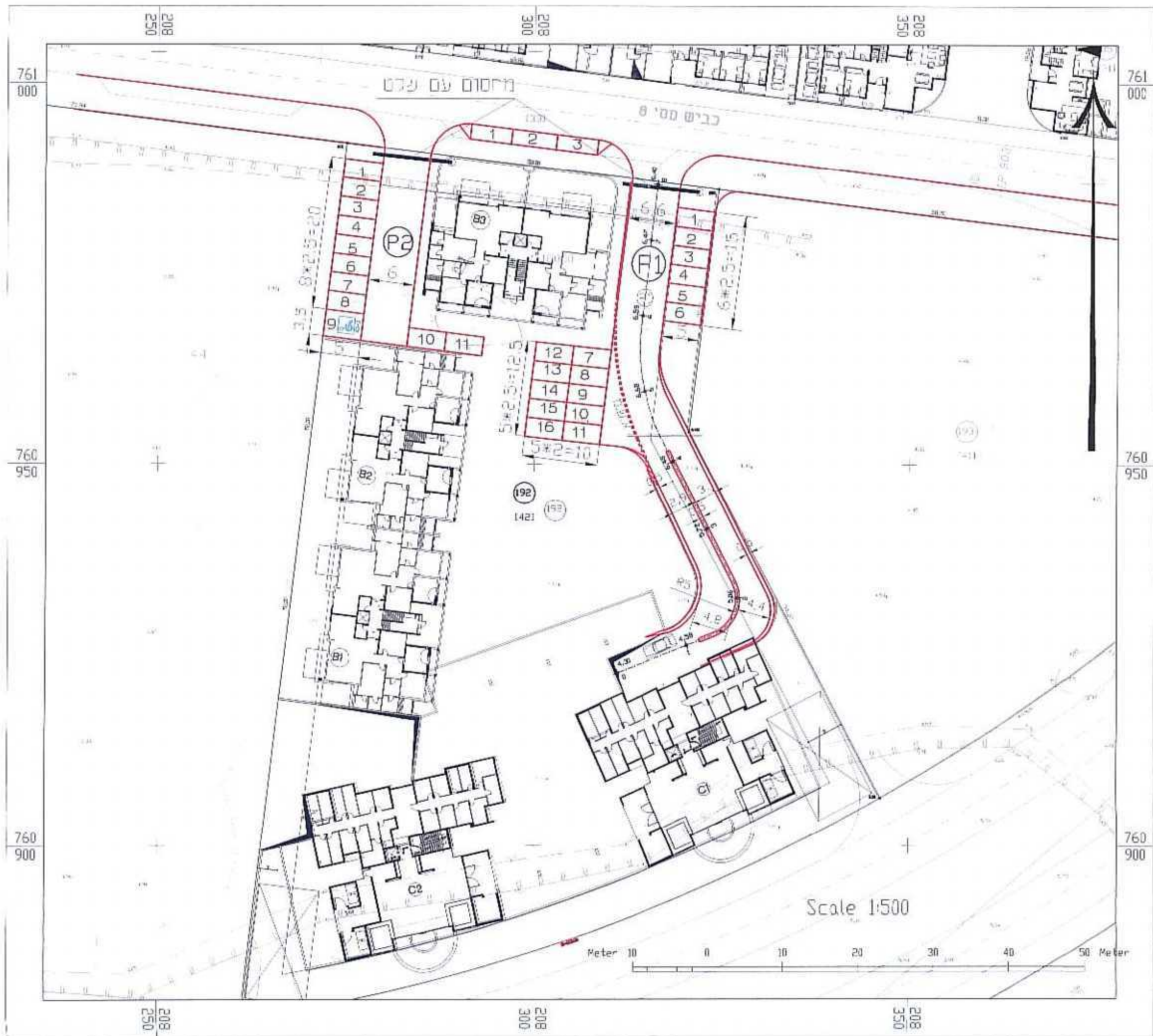
תכנית חניית במפלס העליון, קנ"מ 1:500

חישוב מאזן חניה (כפי כיסוס עם סגירת העיר) 1. חניית משותפת 55 יחידות = 55 חניות 5 יחידות = 23 חניות סה"כ עבוד 78 חניות חלוקה של חניות לפי רבנים - 78 = (p1) \cdot 4 + (p2) \cdot 11 + (p3) \cdot 53 חלוקה של חניות לפי רבנים - 3 רבנים רבנים ו 1 מסחר 2. חניית אישיים סה"כ 5 חניות חלוקה של חניות לפי רבנים - 83 חלוקה של חניות לפי רבנים - 1 + מסחר