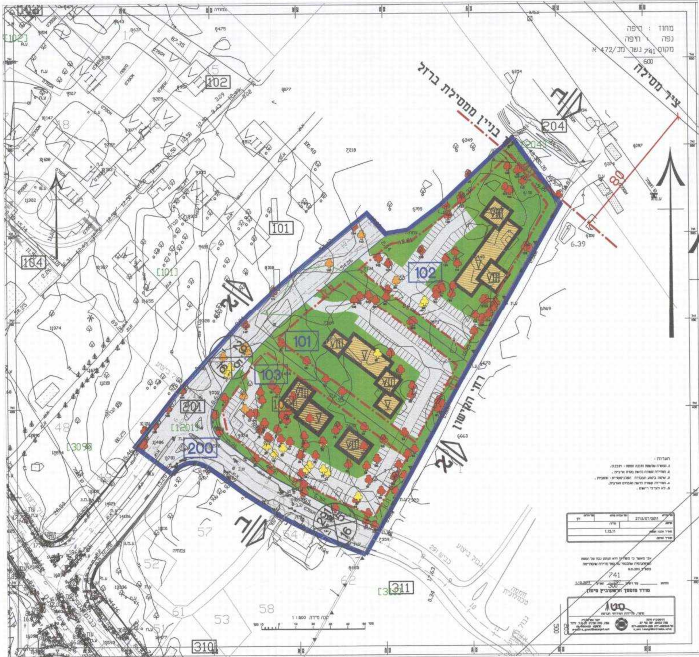
תכנית בינוי קנ"מ 1:1250