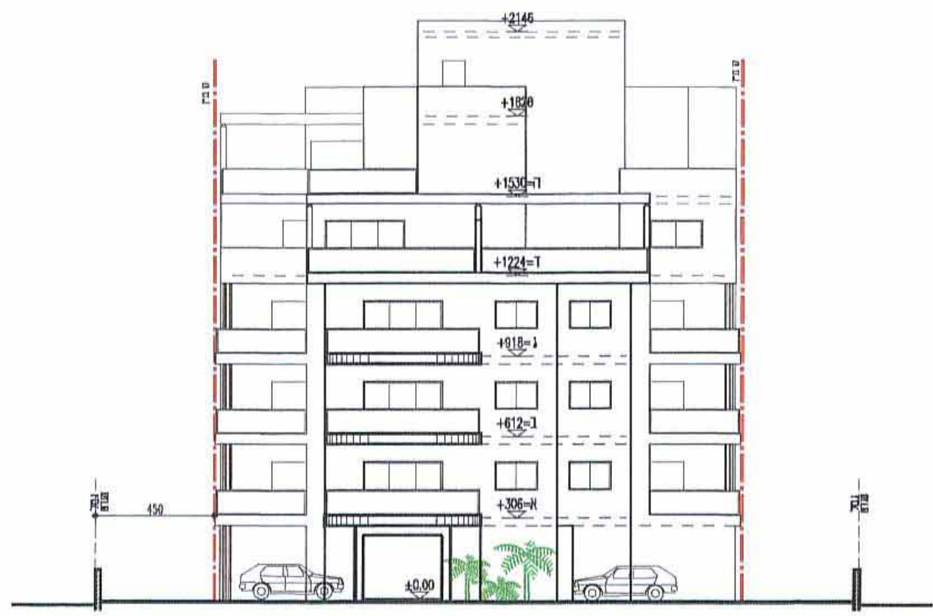
חזית מערבית (רחוב הרצל)