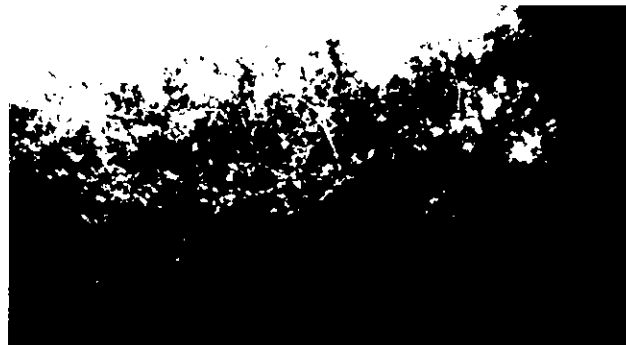
18, 19. סבך עצי אלון