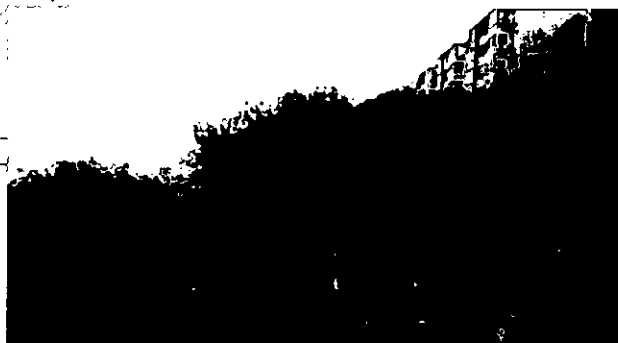
4. אלון מצוי