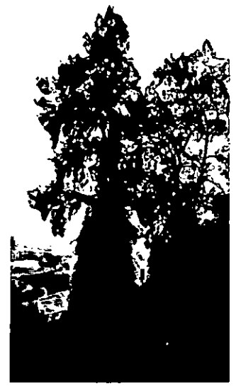
27, 28. קזוארינה