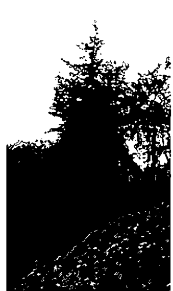
115, 114, 113 . עצי ברוש