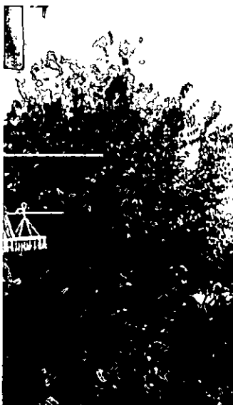
121 . אקליפטוס