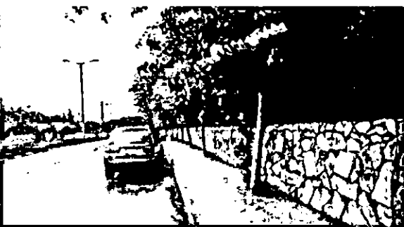
66-109. עצי בוהיניה ברחוב