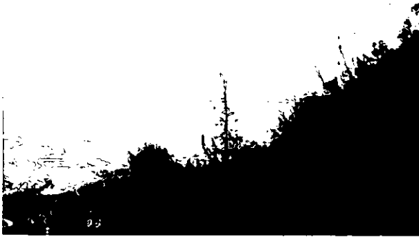
112 . ברוש מת