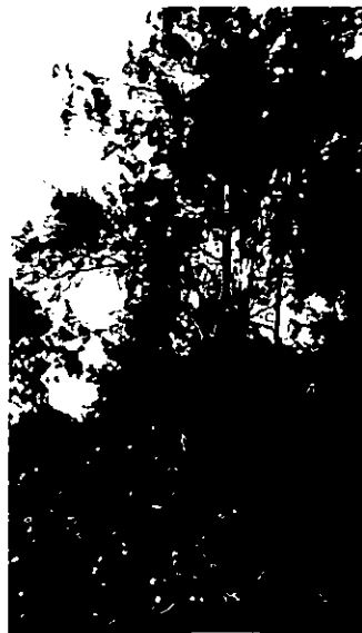
117, 116 . קזוארינה