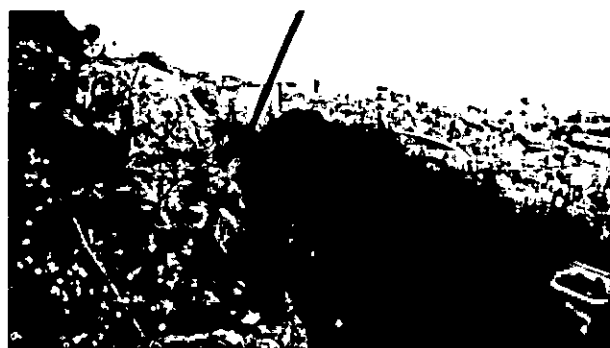
8, 9, 10. קבוצת עצי אלון מצוי