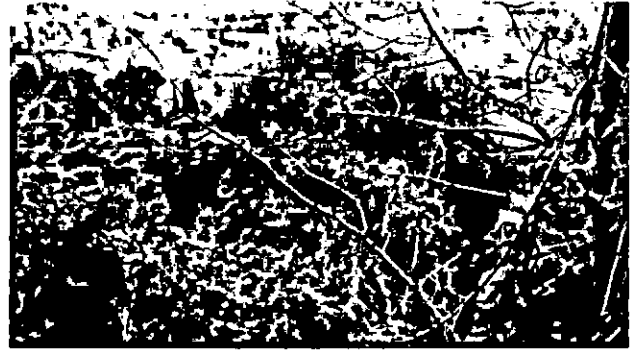
31 - 37. סבך עצים