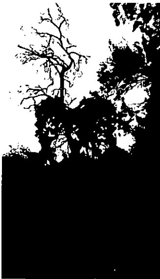
118 . אקליפטוס מת