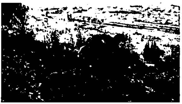
21. אלון מצוי