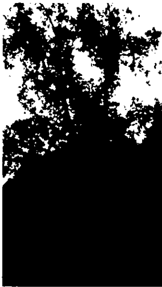
15. אלון מצוי