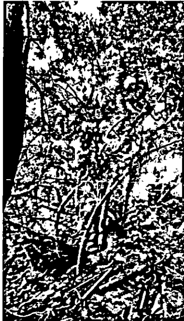
56, 57. אלונים