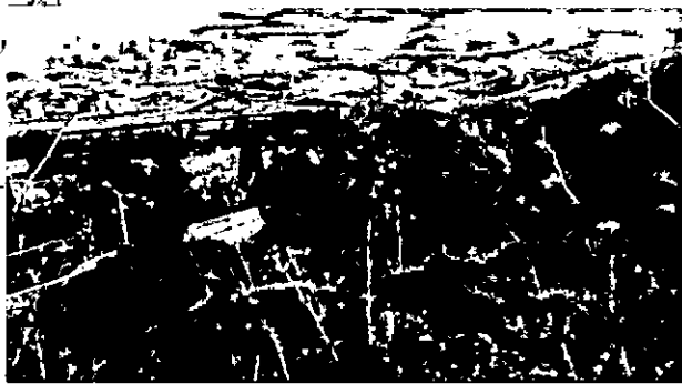
11. אלון מצוי