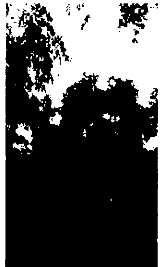
16. אלון מצוי