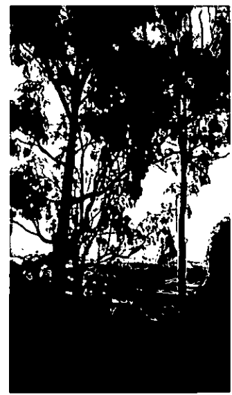
120, 119 . אקליפטוס