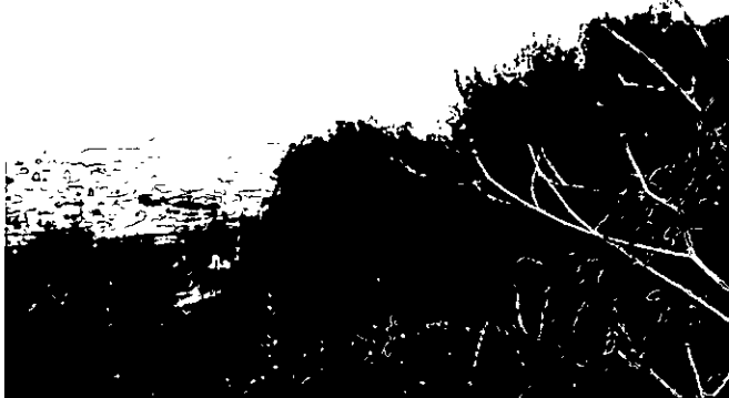
5. אלון מצוי