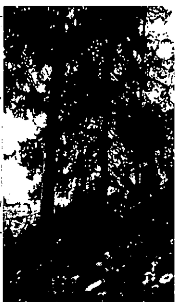
22 - 24. ברוש