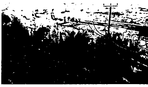
29. אלון מצוי בסבך