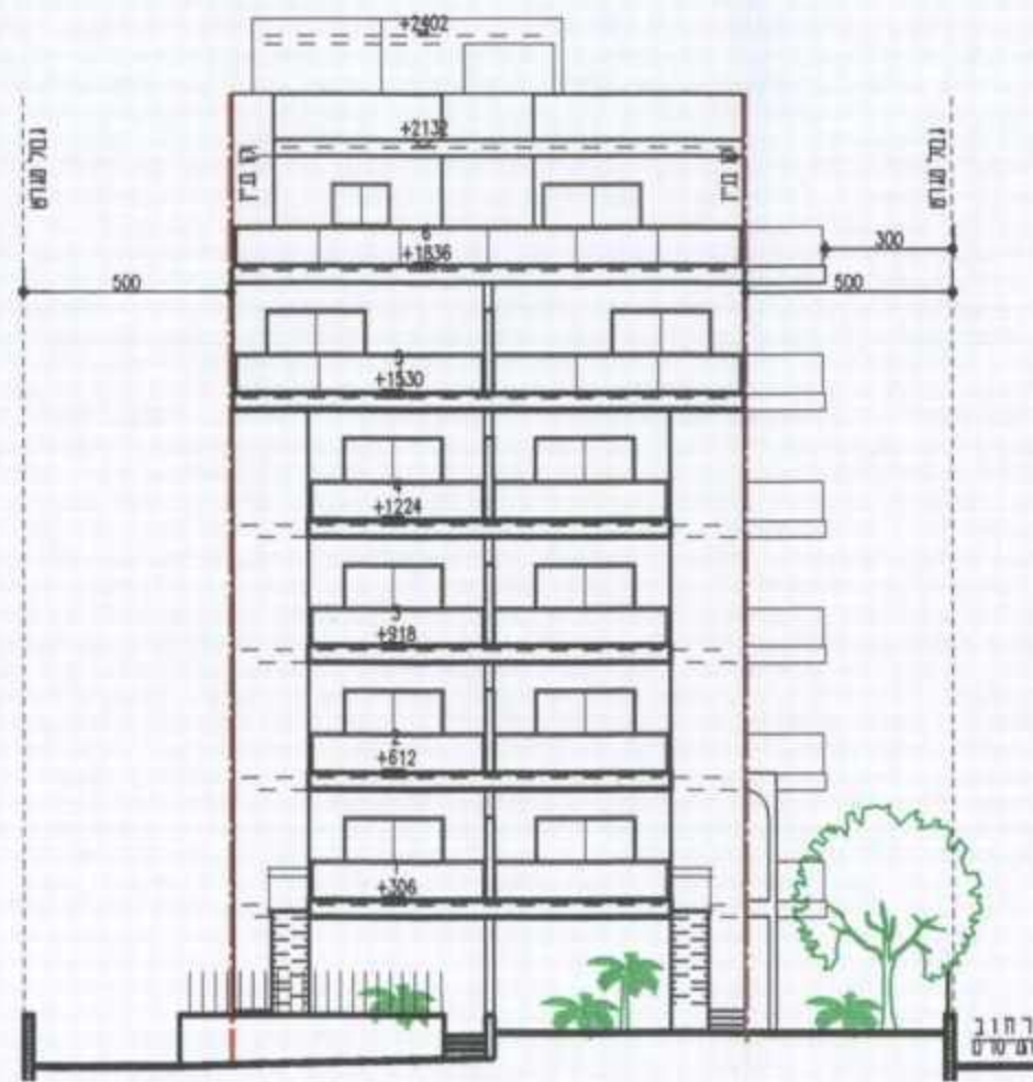
חזית מערבית: רחוב ויצמן