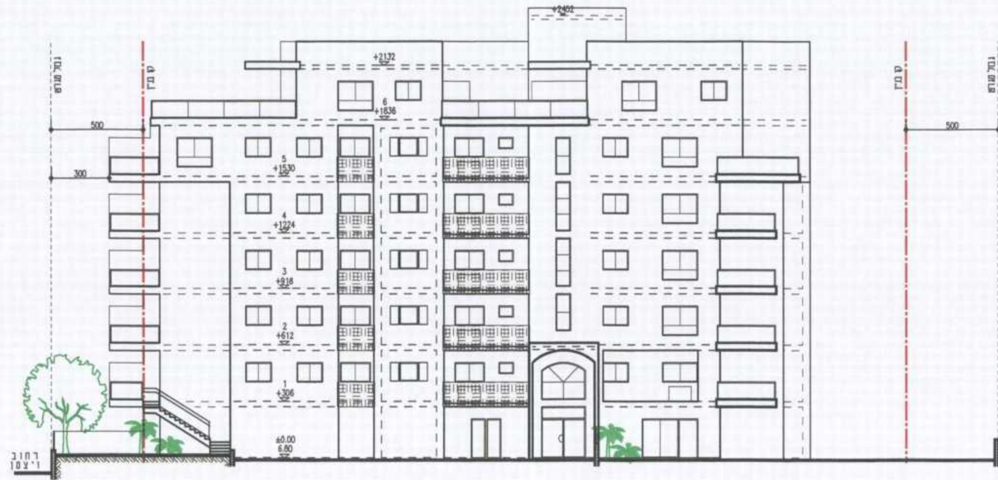
חזית דרומית: רחוב המייסדים