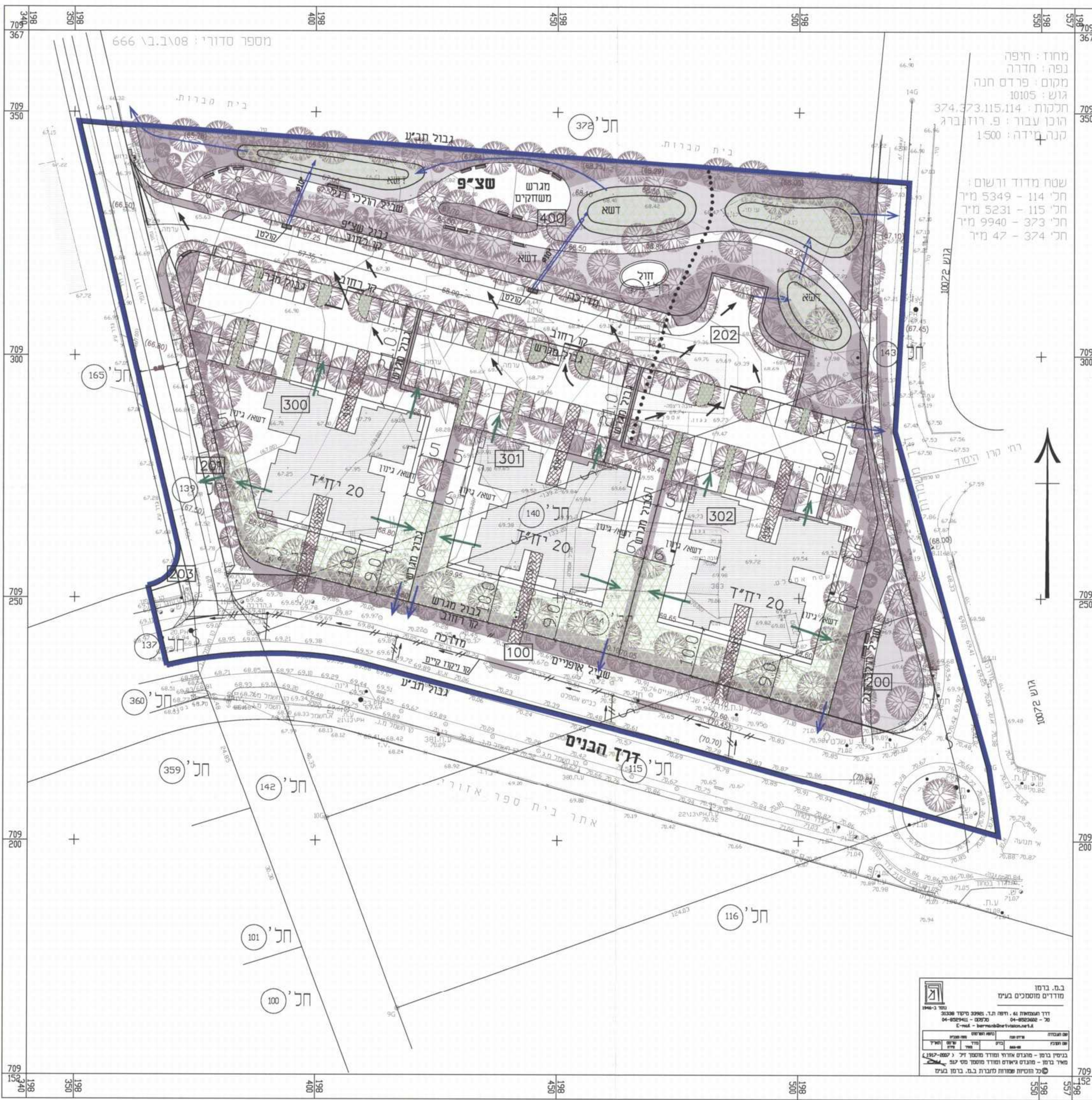
תרשים סביבה 1:5000