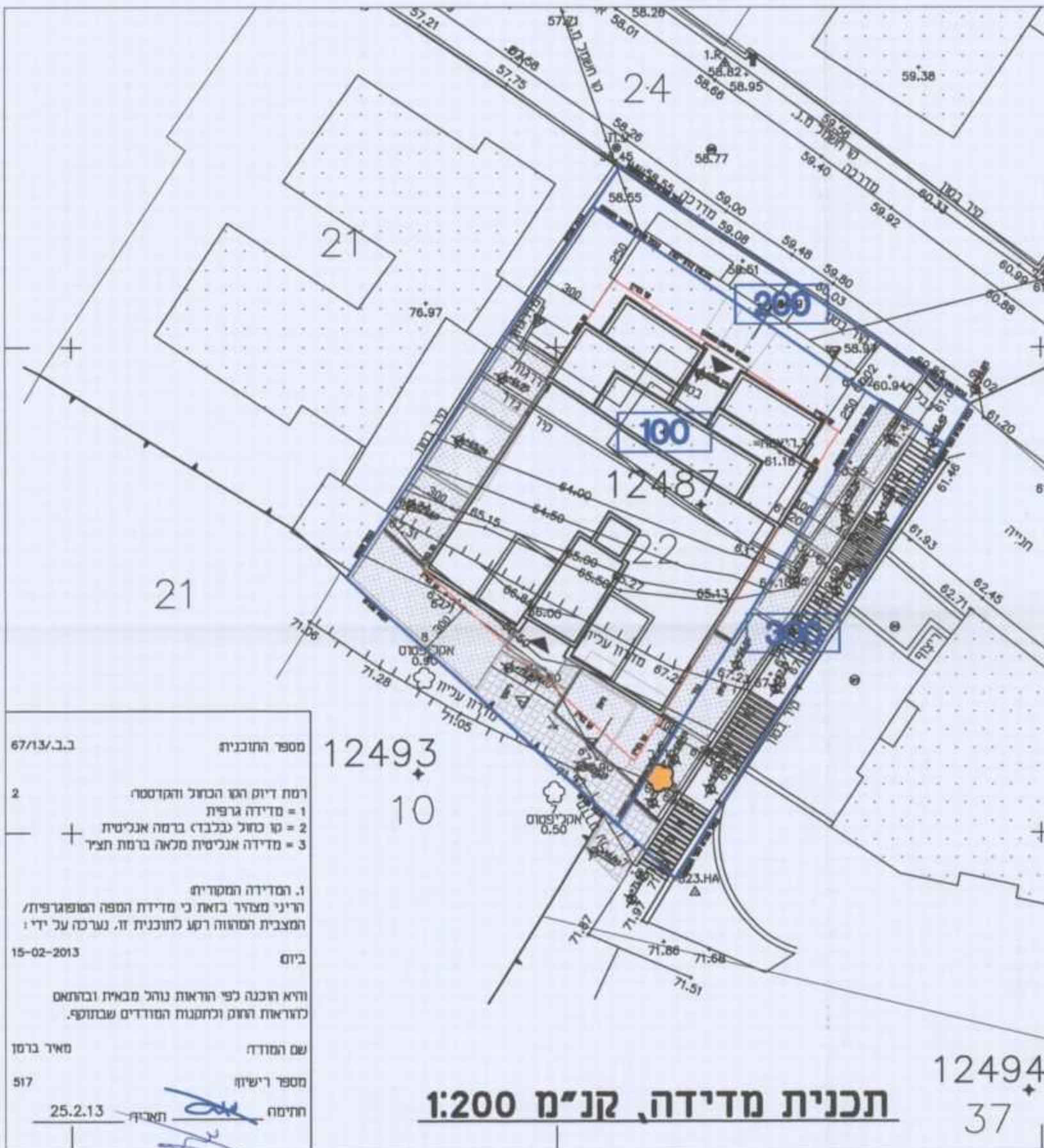
תכנית מדידה, קני"מ 1:200

מספר התוכנית: 67/13/ב.ב. רמת דיוק הגו הכחול והקטנסה 1 = מדידה גרפית 2 = קו חסול (בכבוד) ברמה אנגליטית 3 = מדידה אנגליטית מלאה ברמת חצי 1. המדידה המקורית הריני מצהיר בזאת כי מדידת המפה המופגרת/ה המצבית המהווה רקע לתוכנית זו, נערכה על ידי ביום 15-02-2013 והיא הוכנה לפי הוראות נוהל מבאית ובהתאם להוראות החוק ולתקנות המורדים שבתוקף. שם המודד: מאיר ברטן מספר רישיון: 517 חתימה: 25.2.13