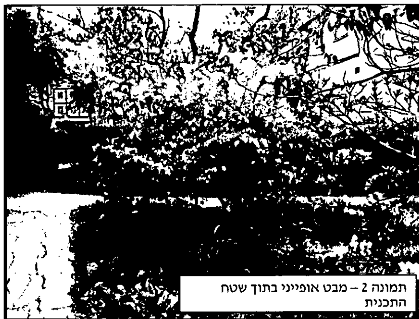
תמונה 2 – מבט אופייני בתוך שטח התכנית