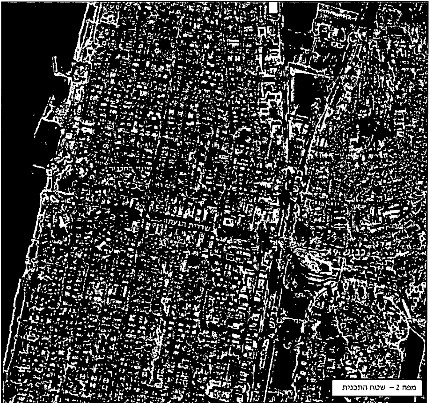
מפה 2 - שטח התכנית

תכנית ג/19385, הינה תכנית לפינוי-בינוי של שמונה מבנים קיימים לאורכו של רחוב פינסקר, בקטע התחום בין רחוב ויצמן במזרח ורחוב ז'בוטינסקי במערב. עיקרי התכנית הינם בניית 5 מבני מגורים (סה"כ 177 יח"ד), בניית חניון תת-קרקעי, שטחי מסחר/משרדים, שטחים מגוננים, שבילים וחניות.