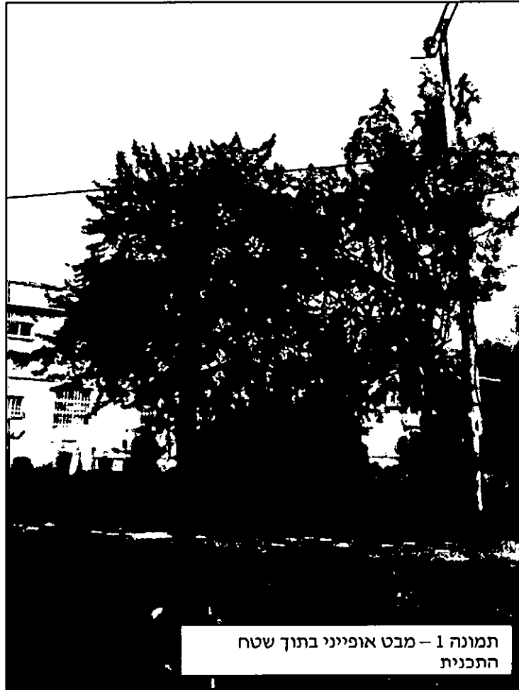
תמונה 1 – מבט אופייני בתוך שטח התכנית