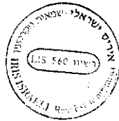
איריס ישראלי שמאית מקרקעין