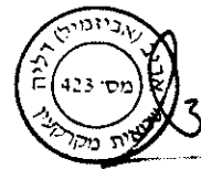
דליה אביב- אביזמיל שמאית מקרקעין