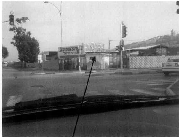
חיפוי תחנת השאיבה.