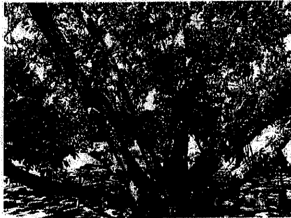
עץ מס' 20 - פקאן