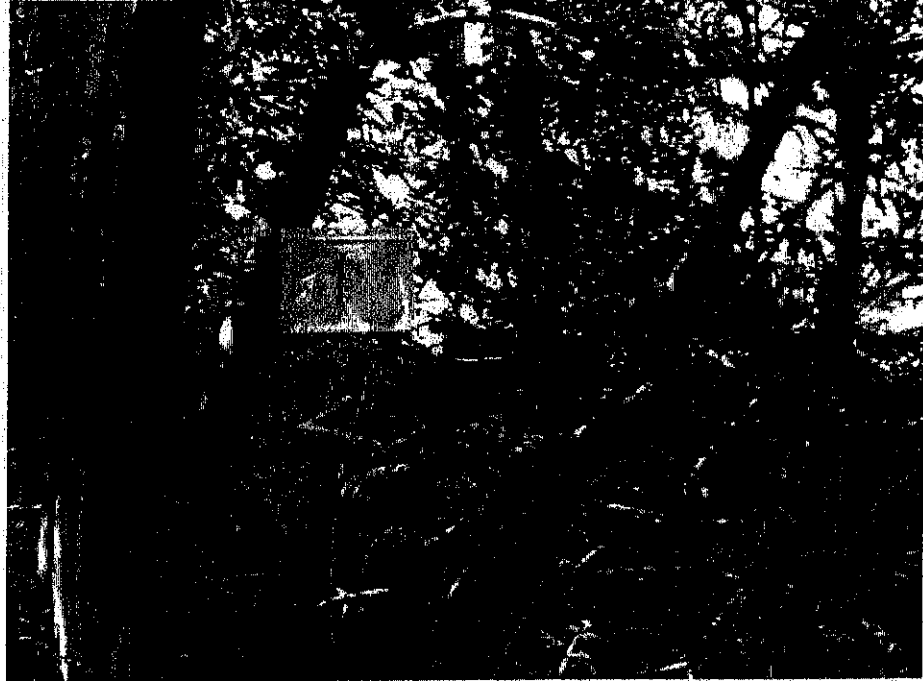
אדרכת – 1