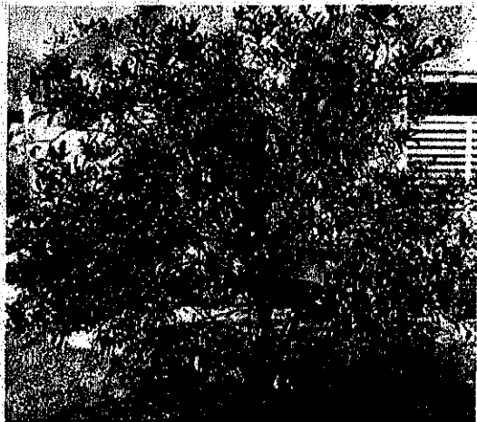
עץ מס' 15 - לימון