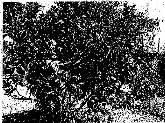
עץ מס' 17 – לימון