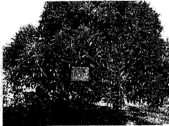
עץ מס' 16 – פרי הדר קלמנטין