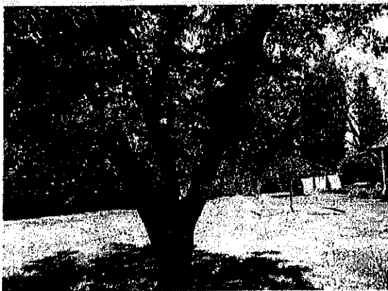
עץ מס' 22 - פקאן