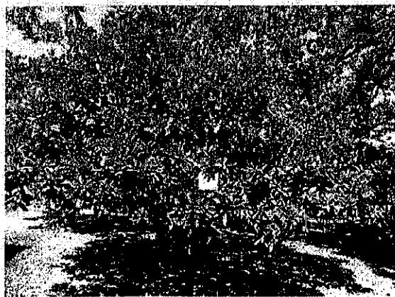
עץ מס' 19 – פומלה