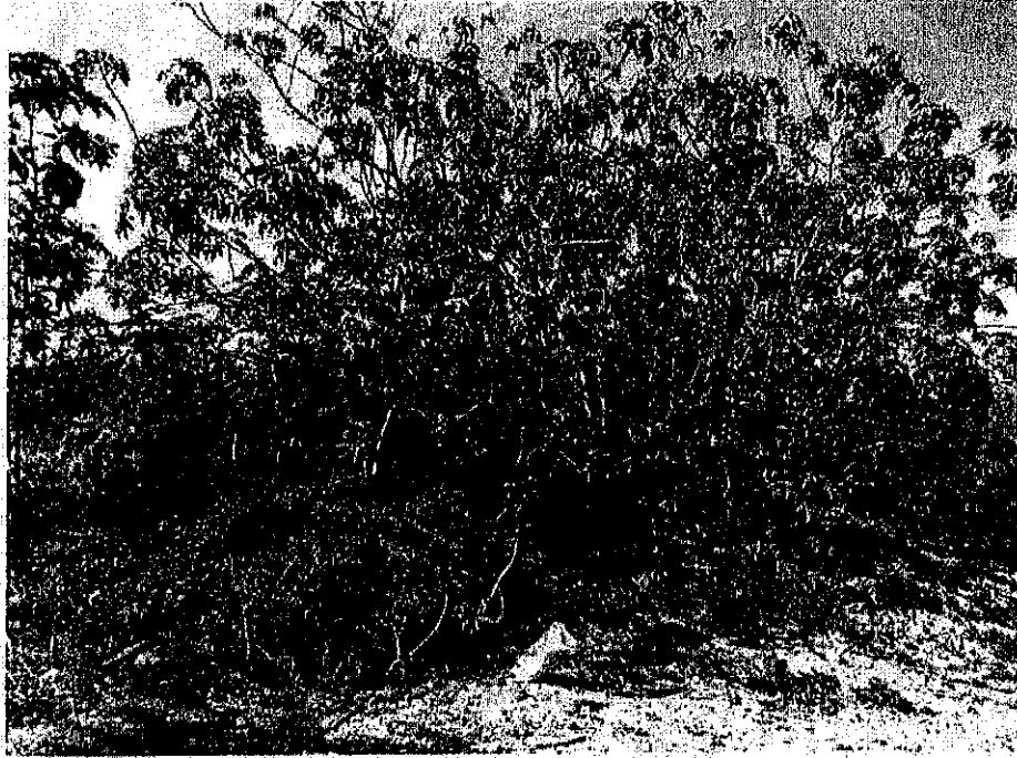
קיקיון - 4-5-6-7-8