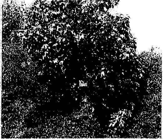
עץ מס' 11 - תאנה