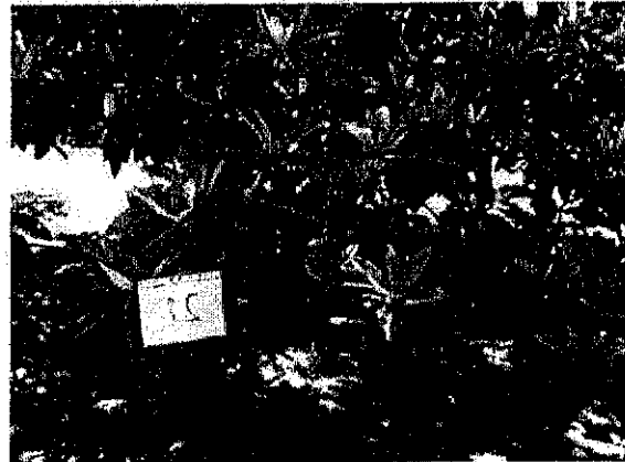
עץ מס' 21 - שסק