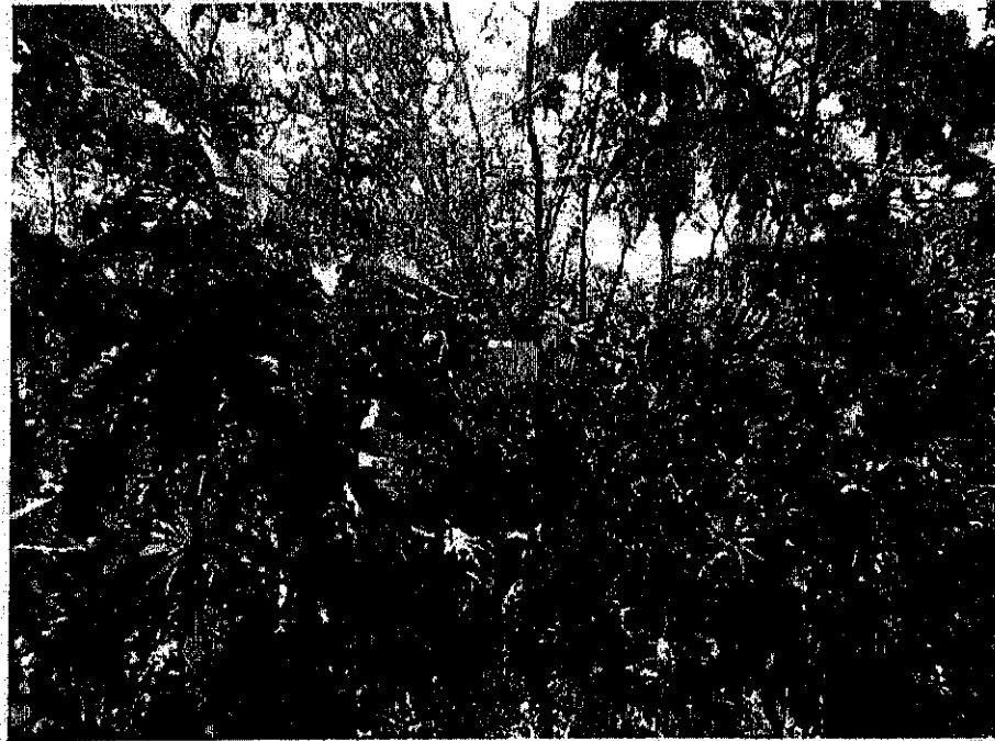
קיקיון - 9