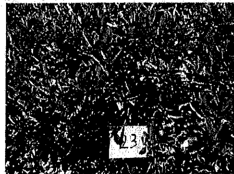
עץ מס' 23 - הדר