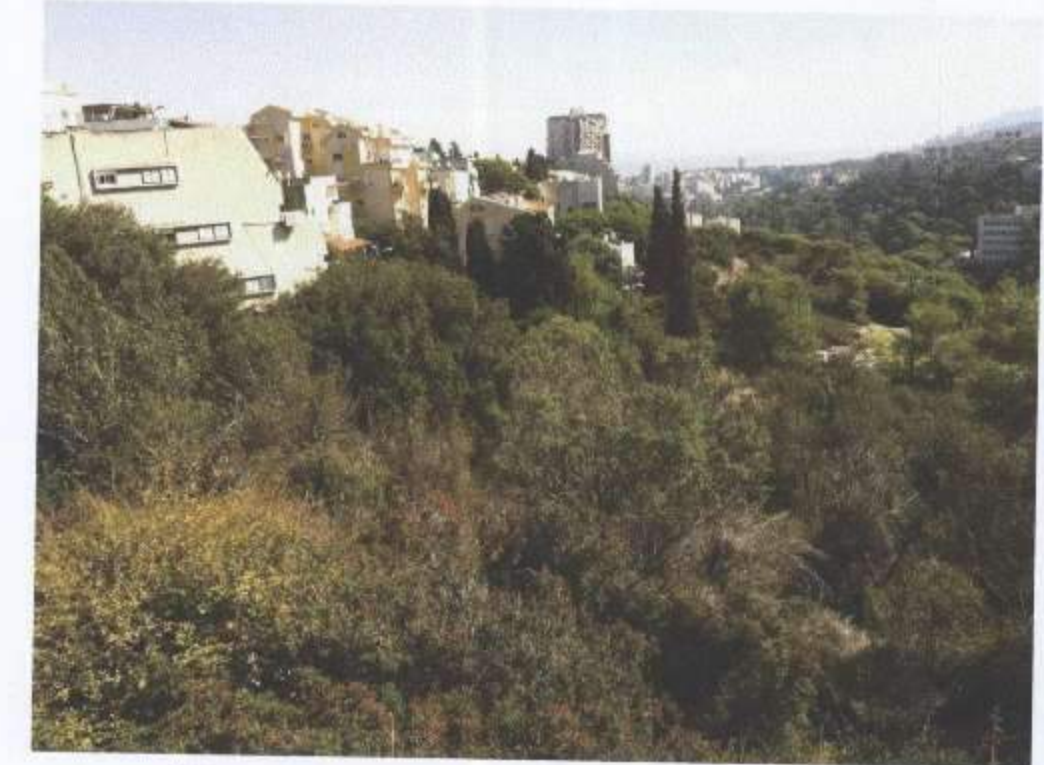
מבט על כלל השטח וברורים בקצה במגרש