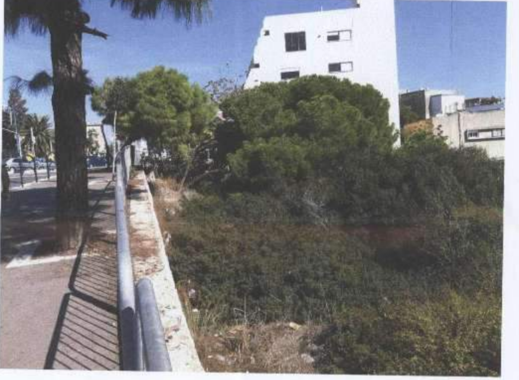
אירנים בפית המגרש