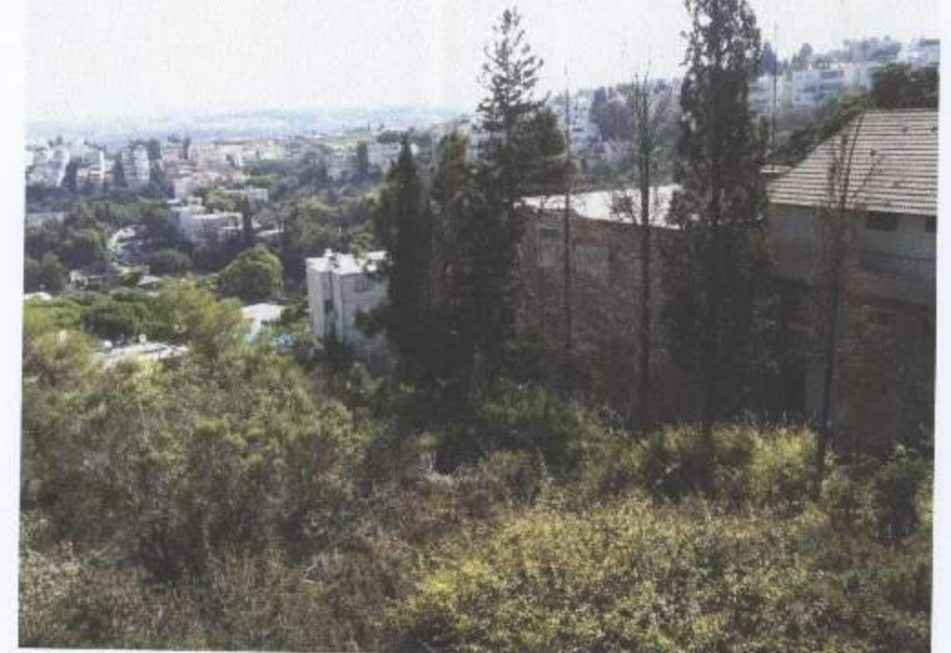
קווארניה לאורך חזית צד מערבי של המגרש