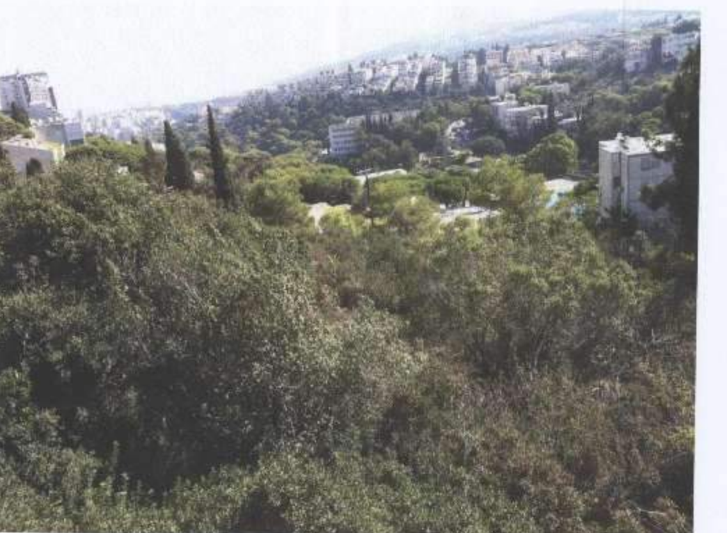
בר זית במרכז המגרש