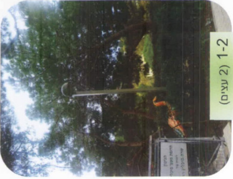
1-2 (2 עצים)