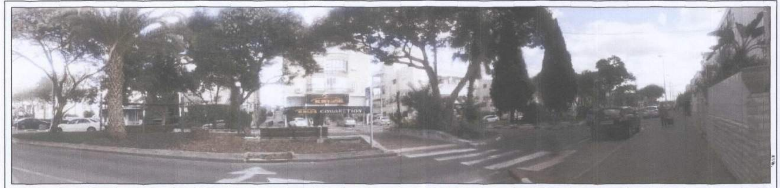
חתך מוצע בי-בי קני"מ 1:200