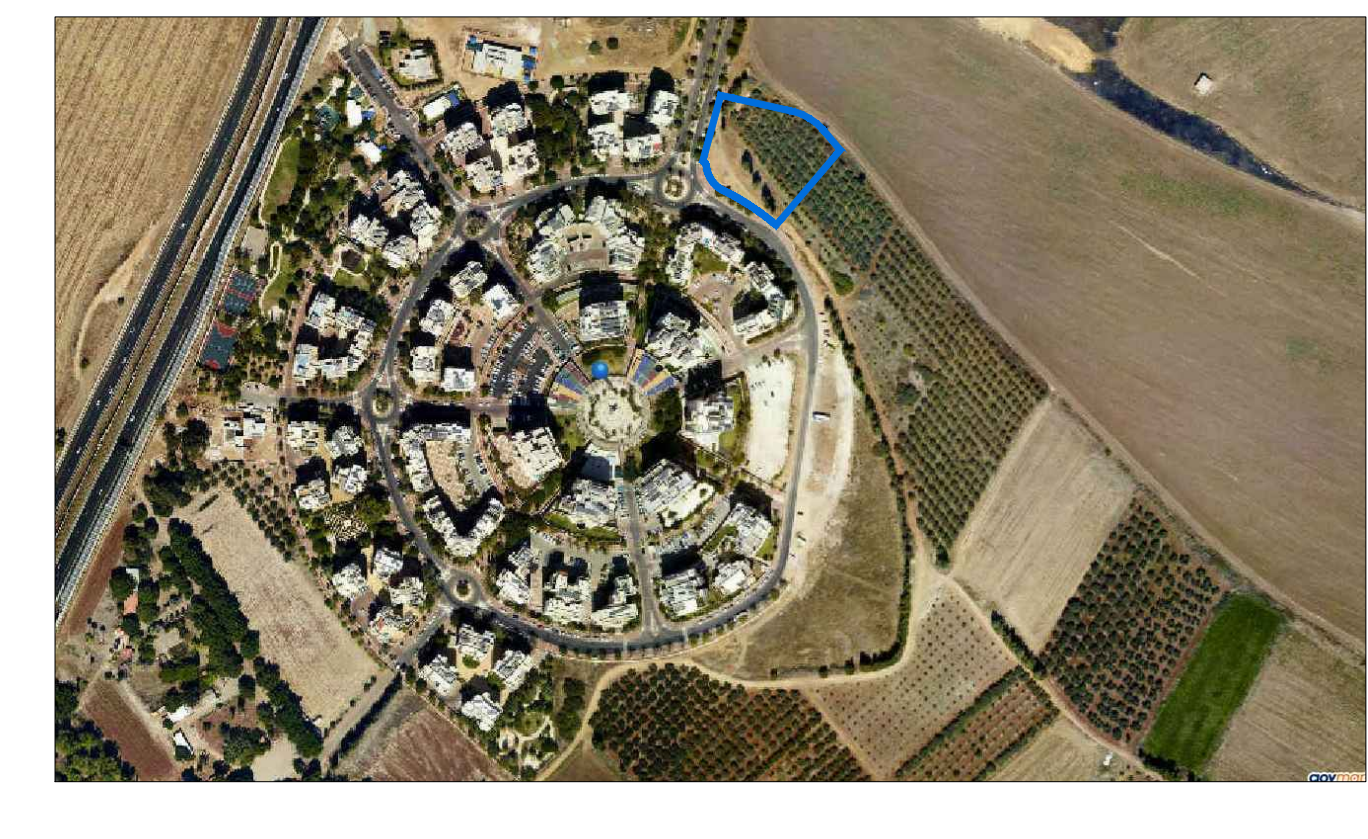
תרשים התמצאות קנ"מ 1:5000