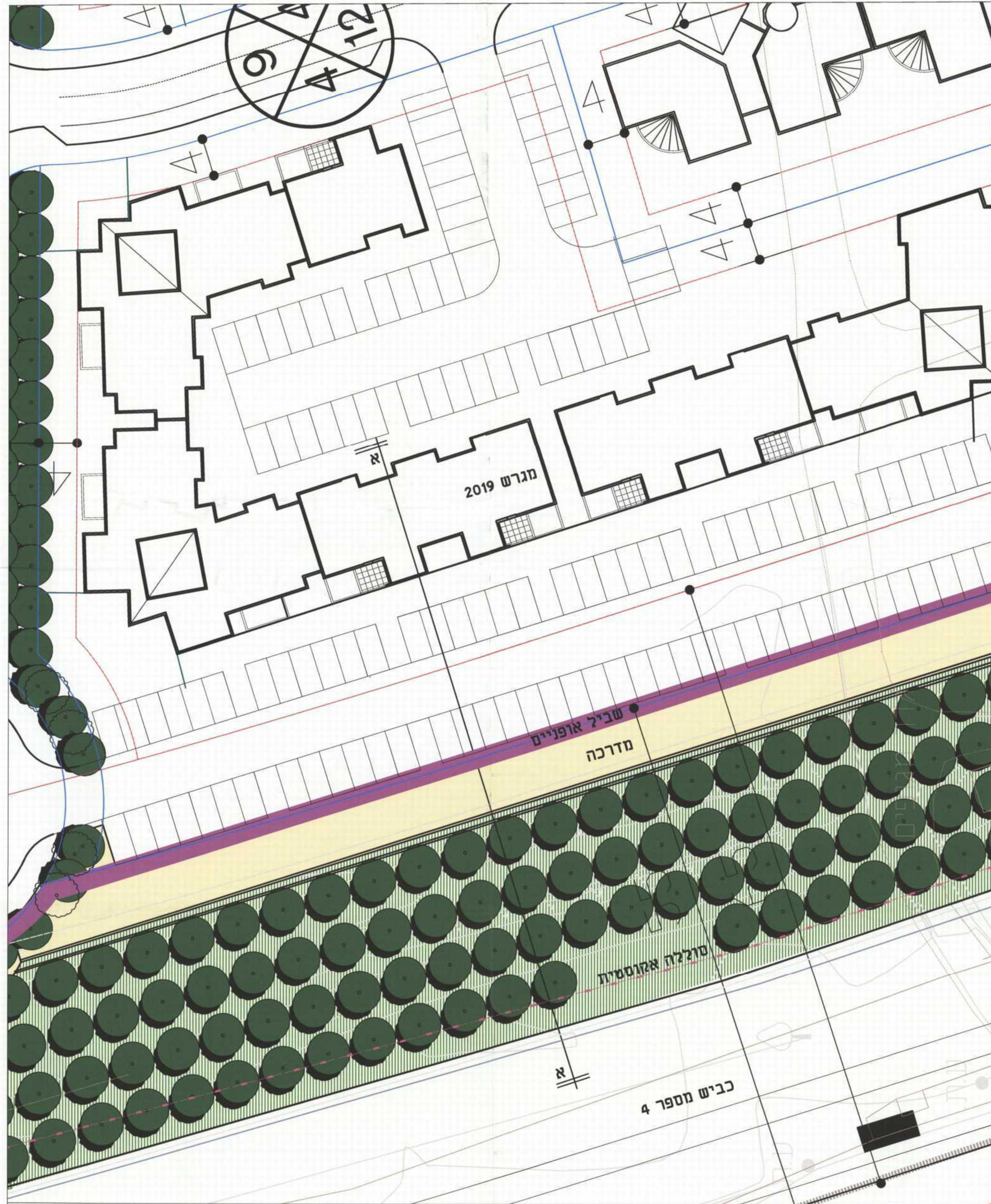
קטע תכנית קנ"מ 1:250

נושרד הפנים מחוז חיפה חוק התכנון והבניה תשכ"ה-1965 אישור תכנית מס' 1/20/582/חכ/ד/א' הועדה המחוזית לתכנון ולבניה החליטה ביום 28.7.2012 לאשר את התכנית. יו"ר הוועדה המחוזית