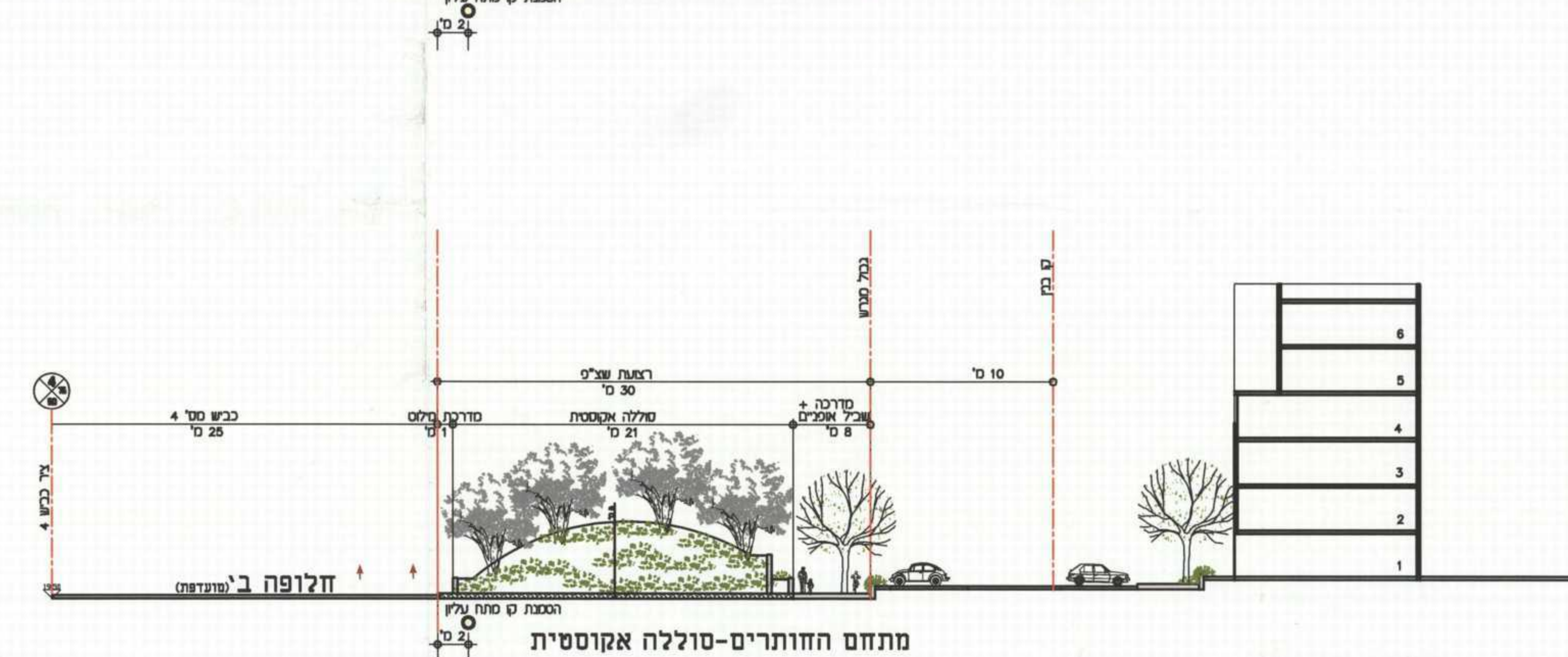
חתך א-א קנ"מ 1:250

הודעה מקומית לבניה ולתכנון עיר חוף כרמל תכנית מס' 1/20/582/חכ/ד/א' הועדה המחוזית לתכנון ולבניה החליטה ביום 28.7.2012 לאשר את התכנית. יו"ר הוועדה המחוזית