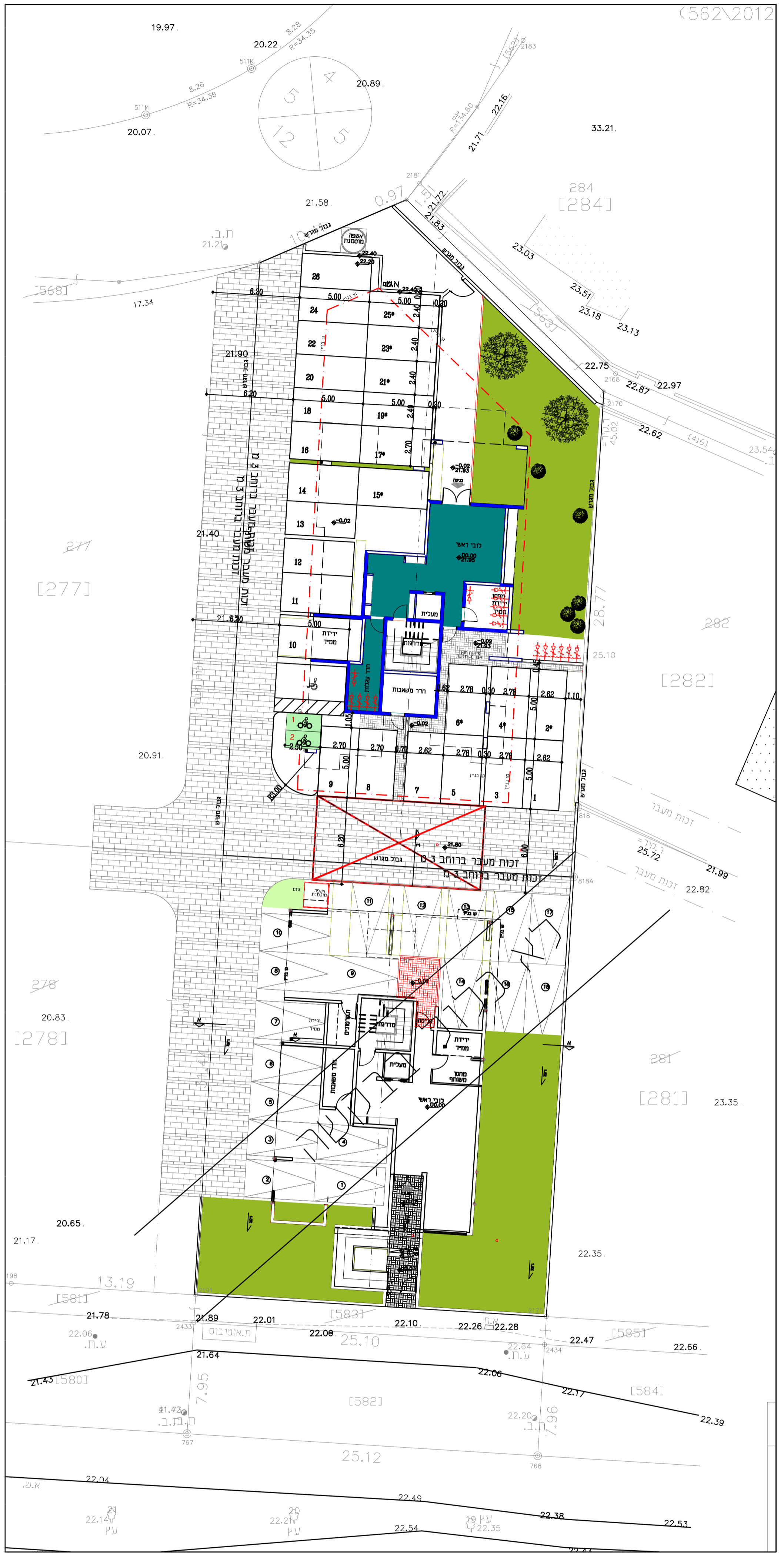
קומת קרקע - קנ"מ 1:200