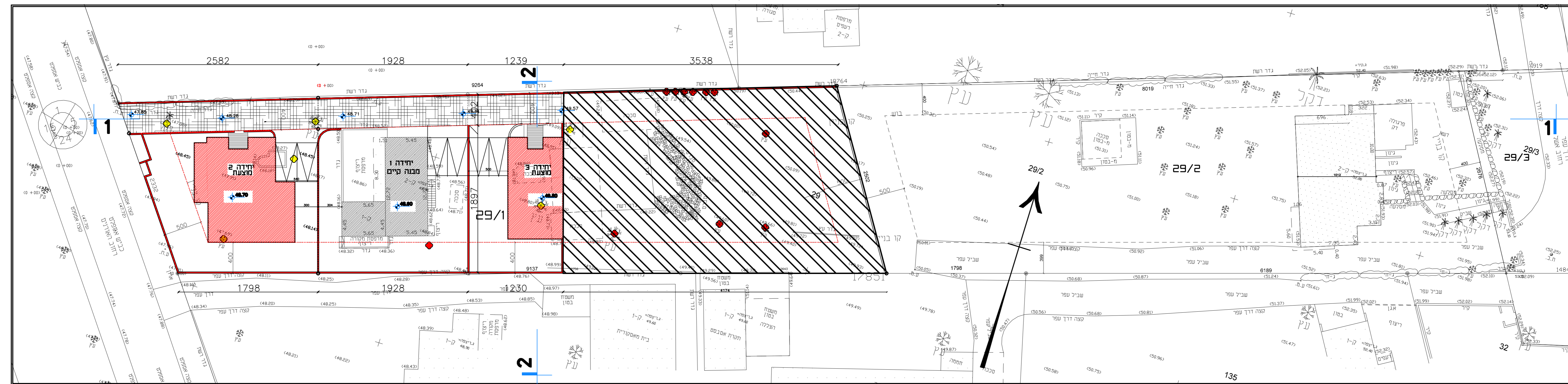
נספח בינוי קני"מ 1:250