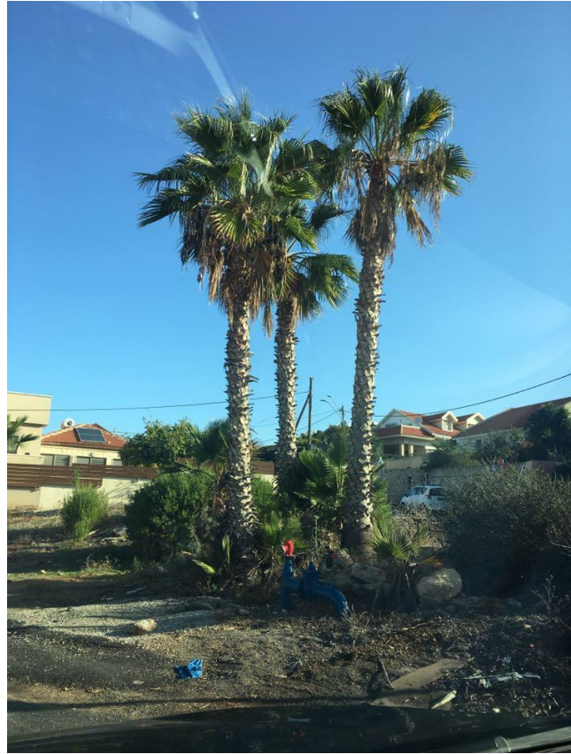
תמונת האתר - עצים מסי 1-3