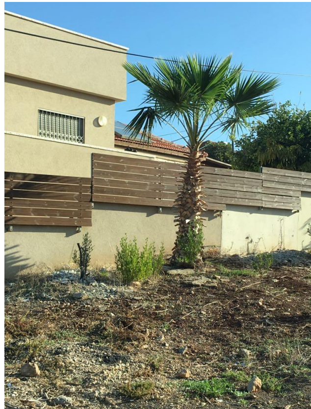
תמונת האתר - עץ מס