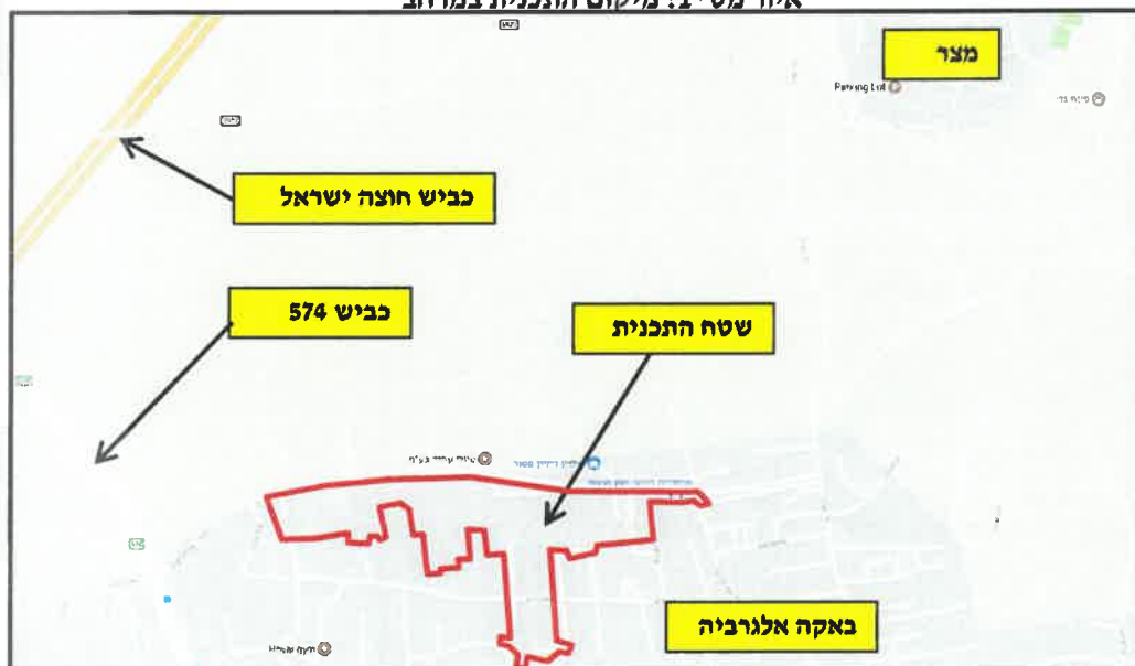
איור מס' 1: מיקום התכנית במרחב

באקה אלגרביה ממוקמת באזור השרון הצפוני מזרחית לכביש 6 בין גית מדרום, מצר מצפון ובאקה אלשרקיה ממזרח.