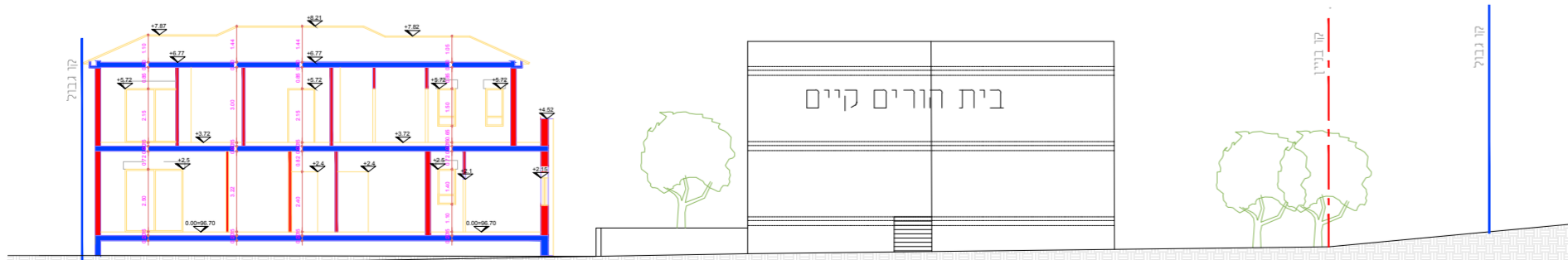
חתר ב-ב קנימ 1:250