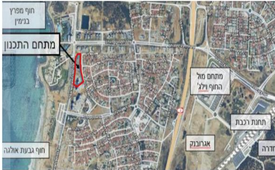
איור 1: מיקום התכנית על רקע מפת סביבה