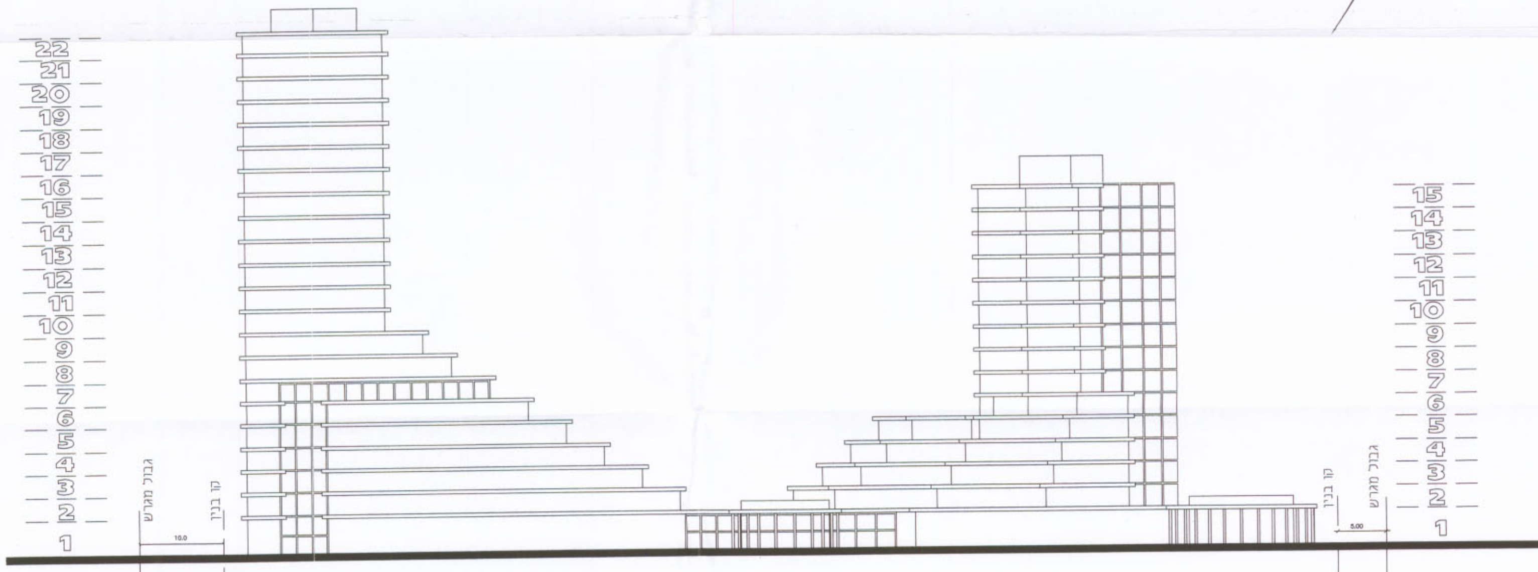
חזית צפונית ק.מ. 500 : 1