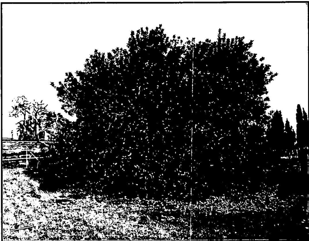
תמונה 4: חרוב מצוי (עץ מסי' 220) להעתקה.