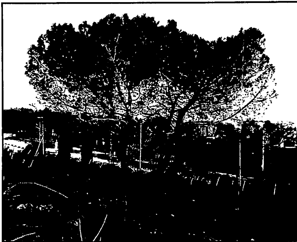
תמונה 1: אורן הצטובר (עץ מסי 305).