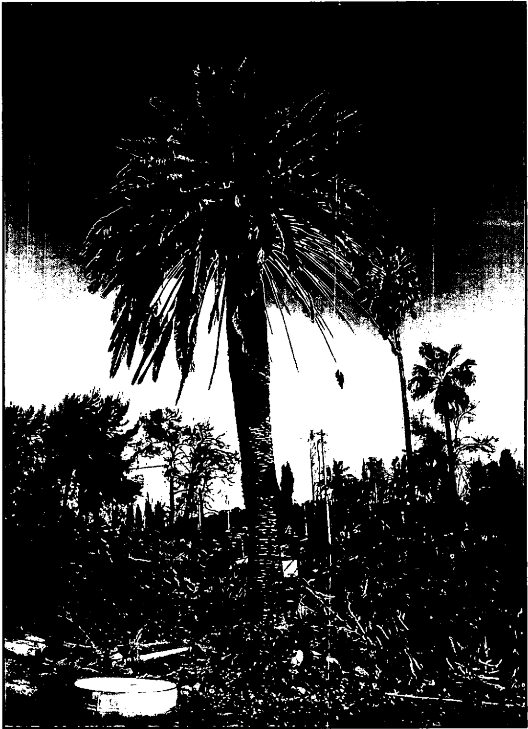
תמונה 5: תמר קנרי (עץ מסי' 155). ממוקם בשטח המוצע למדרכה עם שדרת עצים לאורכה.