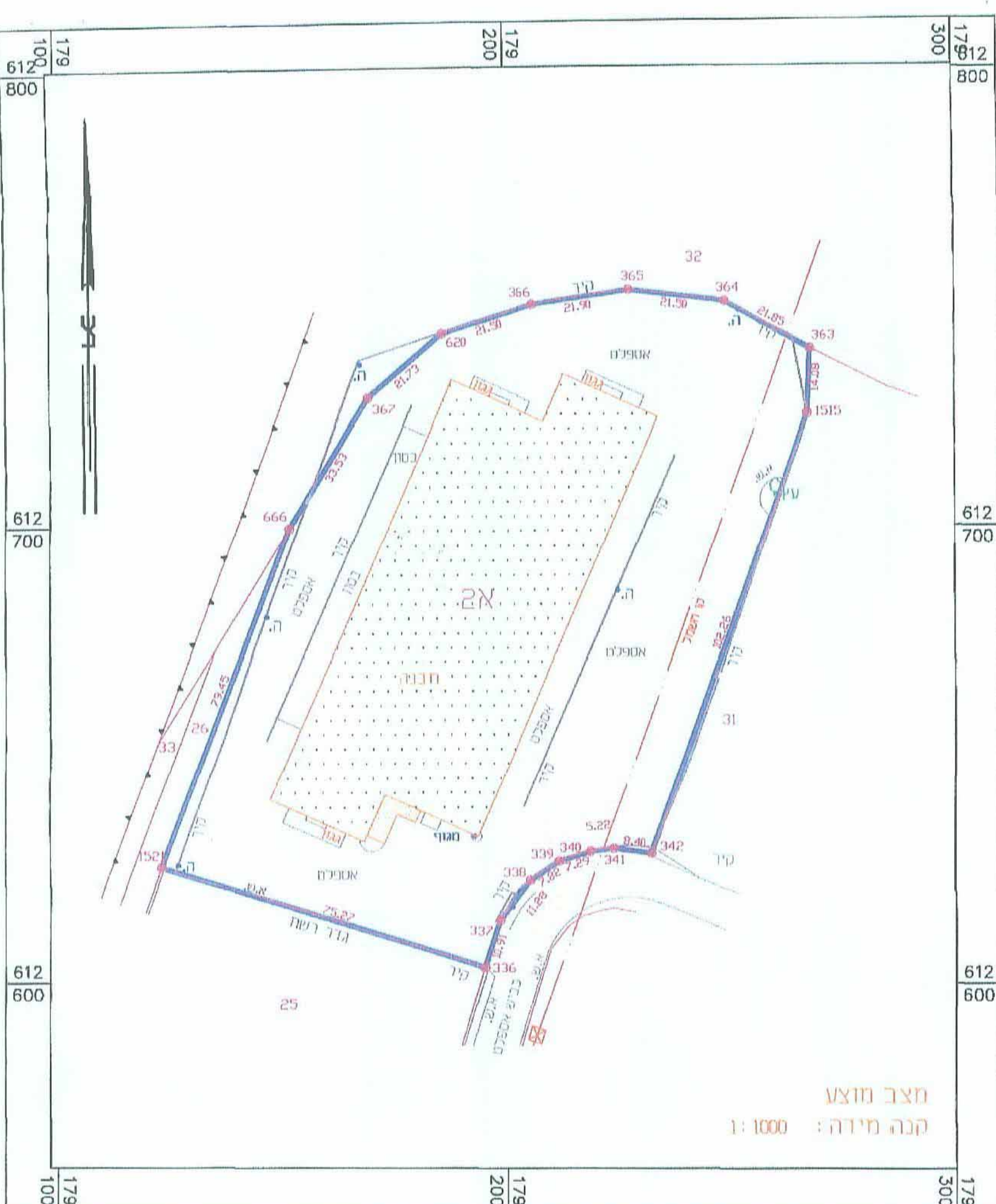
מחצב מוצע קנה מידה: 1:1000