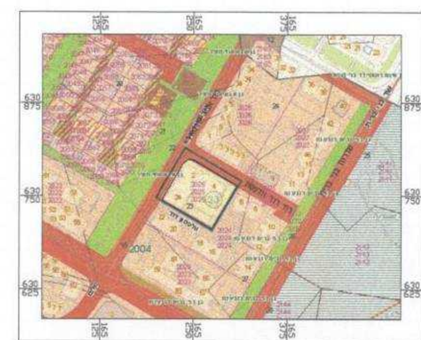
תרשים סביבה 1:2500

שלב: מילוי תנאים למתן תוקף מהדורה: 1 תאריך: 10/10/2011