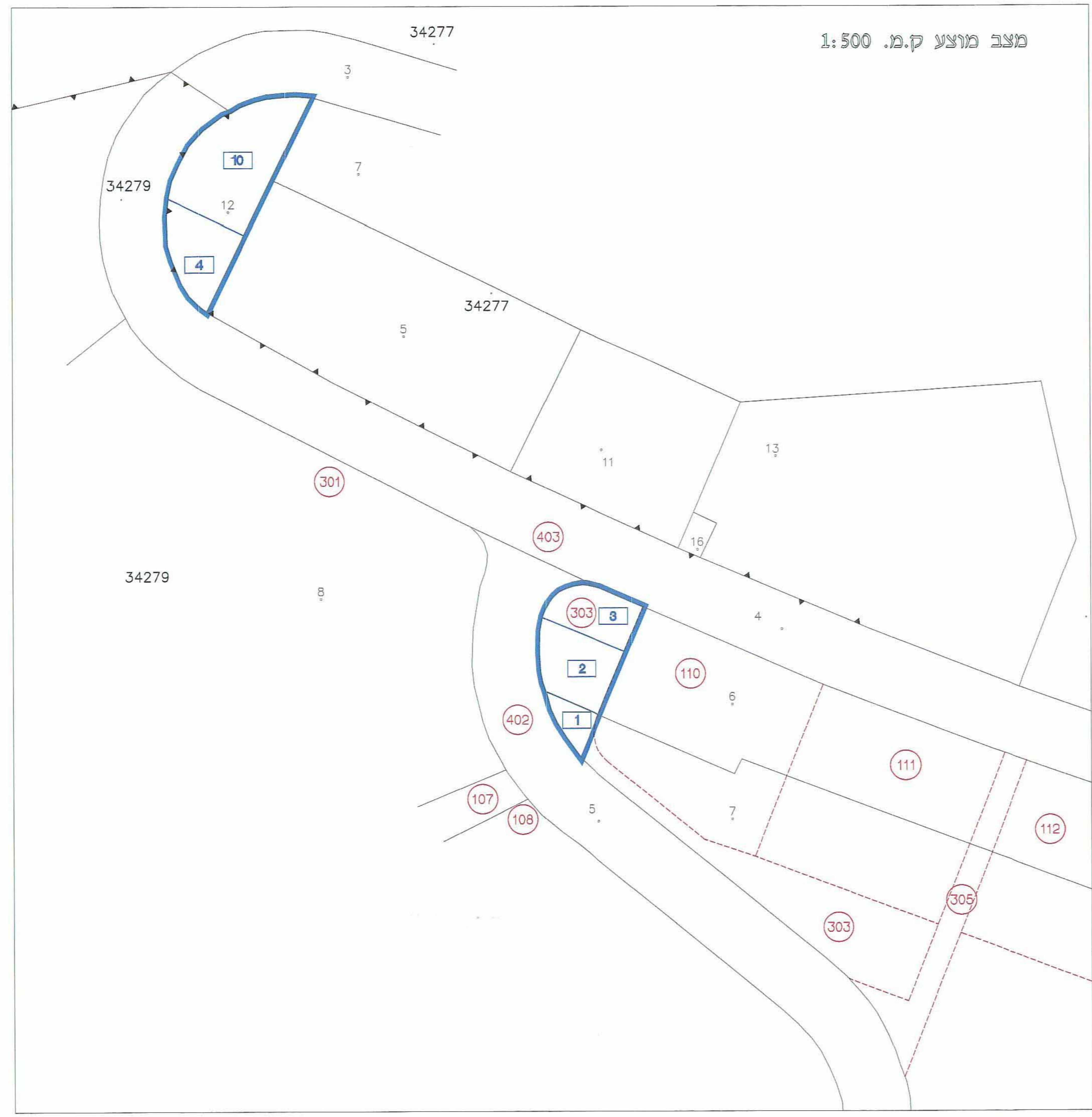
מצב מוצע ק.מ. 1:500