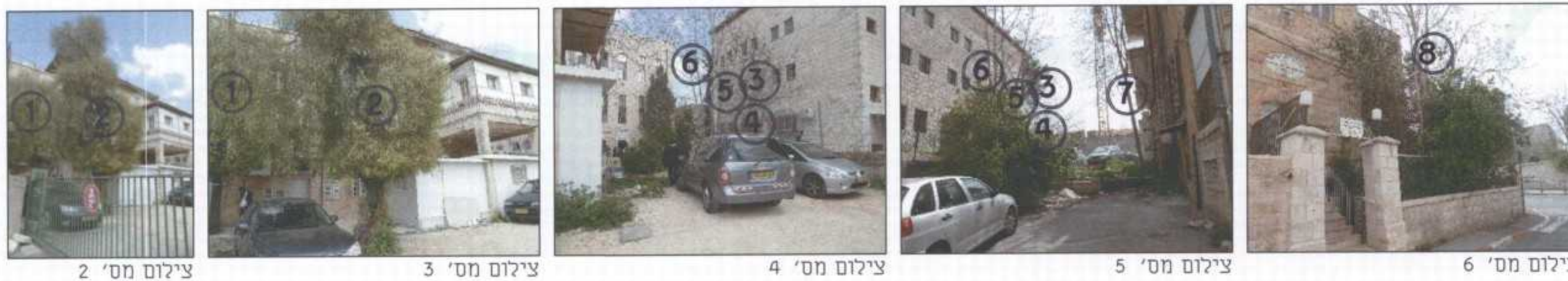
צילום מס' 2 צילום מס' 3 צילום מס' 4 צילום מס' 5 צילום מס' 6