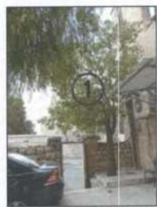
צילום מס' 1